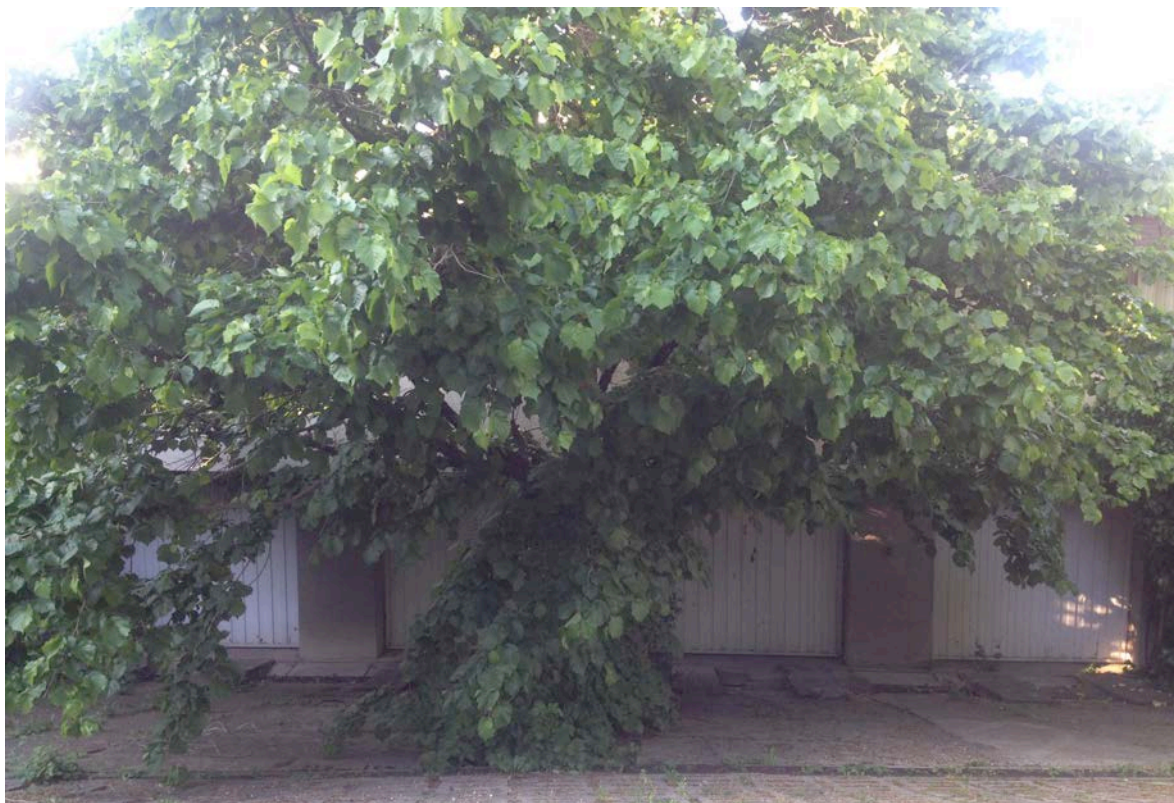
Rózse utca, 2015 április

A kép Buda egyik hegyoldalában, A Rózse utcában készült. A meredek garázsleálló végén hatalmas fa nőtt az évek során, meggátolva a garázsba való beállítás lehetőségét. Mára a fa megléte fontosabb a lakók számára, mint az, hogy beálljanak az autójukkal. Ugyanakkor ez fordítva is történhetett: nem használták a garázs és kinőtt egy fa. Folyamatában nézve azonban mindenképpen volt egy pont, amikor a lakók számára világossá vált, hogy számukra a fa fontosabb.