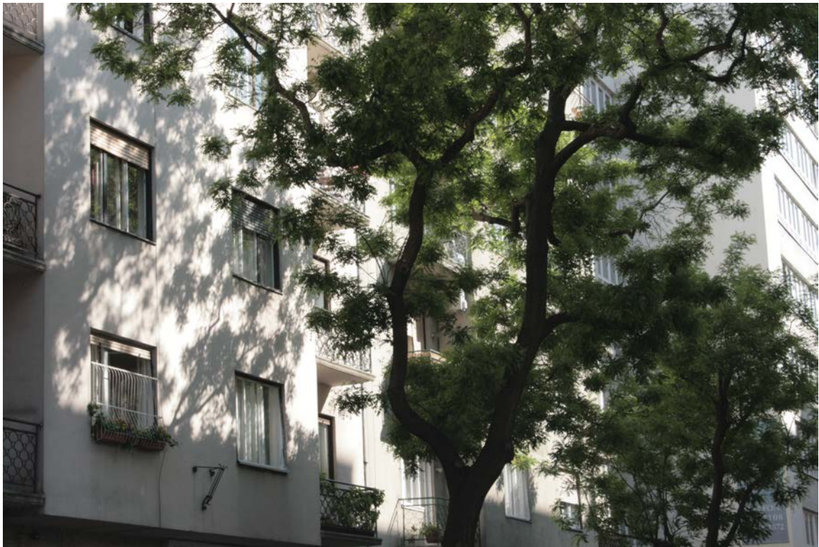
Budapest, Visegrádi utca, 13.kerület, 2013 május

Bár a kép csak egy részlet, ez az egyensúly az egész utcában megjelenik. A fák és az épületek az ember szemszögéből egy időben léteznek, végigkísérik az életét a városban, nagyjából végig ugyanazok az épületek és ugyanazok a fák, míg a város más elemei gyakrabban cserélődnek vagy tűnnek el, jelennek meg. A kép és az utca egyensúlyérzetét ("Az érzet erősebb, mint az ember", Malevics: A tárgy nélküli világ) itt talán épp az az időbeli egyezés adja, hogy a fa és az épület nagyjából egyszerre kerültek a városba, egy idősek.