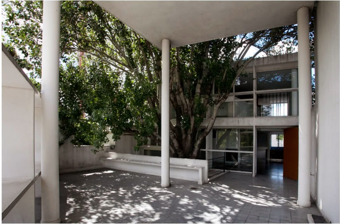
Maison Curutchet, La Planta Argentina, Le Corbusier, 1949