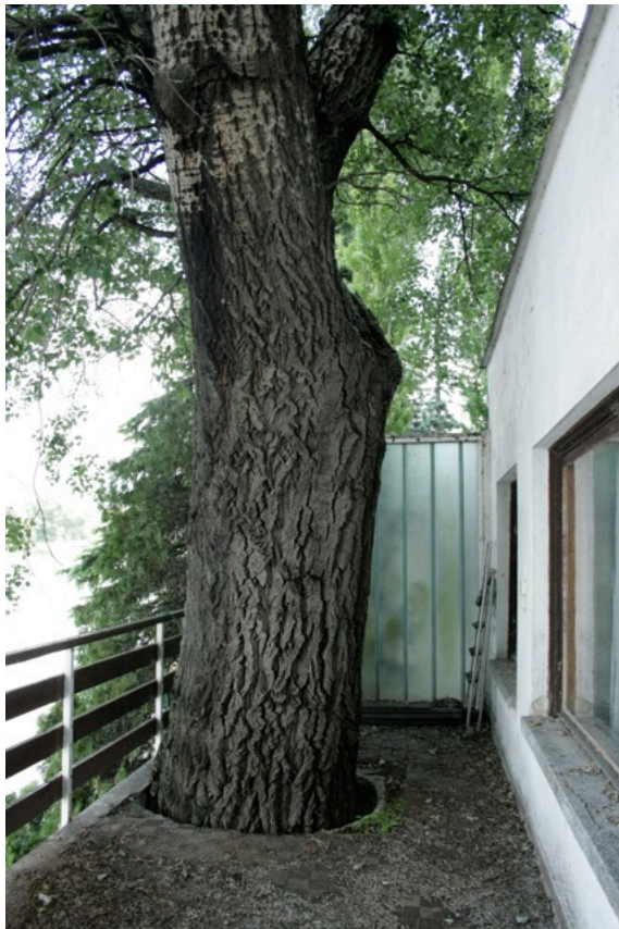
nyaraló a Lupaszigeten, kb. 1970