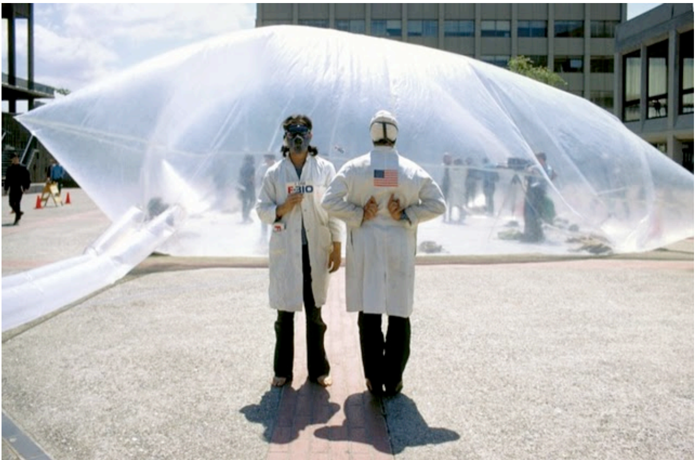
Inflato Cookbook, Antfarm Collective

A 60-as évek mozgalmaival kezdődően a képzőművészek jelentős része társadalmi kérdések felé fordul. A 30-as évektől köztudatban élő Public Art (Köztéri Művészet) jelentése - valamilyen reprezentatív szobor, tárgy elhelyezése a városi terein - alapjaiban átalakul. A változásokra érzékeny művészek a hivatalos fórumoktól (múzeumok, galériák, kiállítóterek) elfordulnak. Egy részről a természeti táj (Land Art, Robert Smithson munkái) más részről a városi terek, az utcák, a parkok válnak a művészi kifejezés és társadalom kritikájának egyik legfontosabb felületévé (Agnes Denes, 1982, Wheatfield A kísérletezik városi köztereken, alternatív használatok, nézőpontok vagy éppen városi utópiák után kutatva. Néhány példa: az 1967-ben alakult bécsi Haus-Rucker-Co csoportot és a városi érzékelést módosító munkájuk a Flyhead; az 1968-ban alapított san franciscoi ANT FARM stúdió felfújható kísérleti tere (Inflato Cookbook) vagy akár a Coop Himmelblau ideiglenes térkísérleteit a városi tereken (Soft Space 1970). A kezdeti kísérletezési kedv aztán háttérbe szorul a hagyományos építészeti eszköztár mellett. A nemzetközi építészeti közélet radikális változásokon megy át az elmúlt 1-1,5 évtizedben. Miközben egyes építészek nemzetközi sztárokká válnak, mások új szerepeket és feladatokat keresnek.