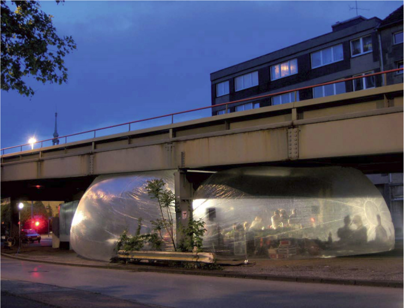
Spacebuster, Raumlabor