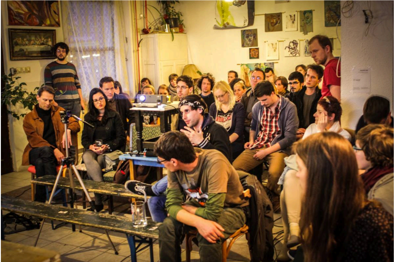
Gólya | előadások és beszélgetések | informális tanulás lehetősége