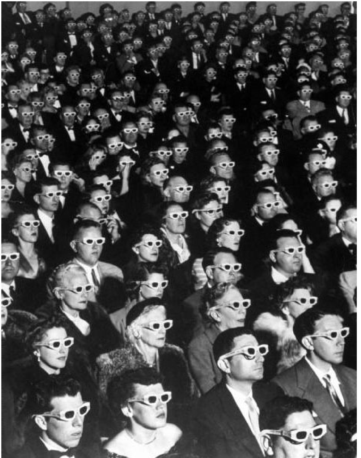
A Spektáculum Társadalma | Guy Debord | Film