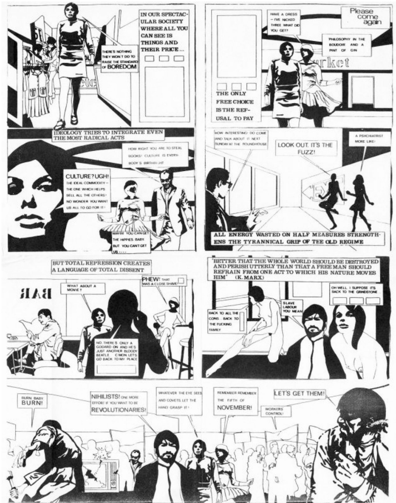
Sztuacionista Képregény az eltérítés módszerével létrehozva | angol | Raoul Vaneigem és André Bertrand |1967