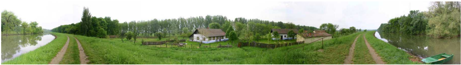
a tábor nagyvíz idején