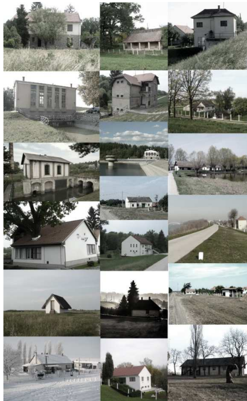
^elhagyott és eredeti funkciójukat betöltő gátórházak

Az ártér első (vagy utolsó) a településhez köthető építményei. Az említett gátórházak az átalakult munkavégzésnek köszönhetően néhol elnéptelenednek, funkciójuk megszűnik, átalakul. Helyüket több helyen átveszik a mérőállomások.