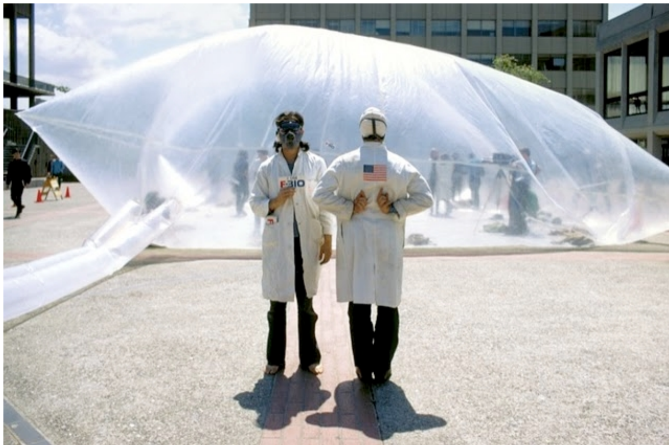
Inflato Cookbook, Antfarm Collective

városi köztereken, alternatív használatok, nézőpontok vagy éppen városi utópiák után kutatva. Néhány példa: az 1967-ben alakult bécsi Haus-Rucker-Co csoportot és a városi érzékelést módosító munkájuk a Flyhead; az 1968-ban alapított san franciscoi ANT FARM stúdió felfújható kísérleti tere (Inflato Cookbook) vagy akár a Coop Himmelblau ideiglenes térkísérleteit a városi tereken (Soft Space 1970). A kezdeti kísérletezési kedv aztán háttérbe szorul a hagyományos építészeti eszköztár mellett. A nemzetközi építészeti közélet radikális változásokon megy át az elmúlt 1-1,5 évtizedben. Miközben egyes építészek nemzetközi sztárokká válnak, mások új szerepeket és feladatokat keresnek.