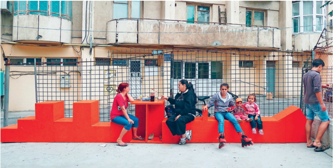
The Generator