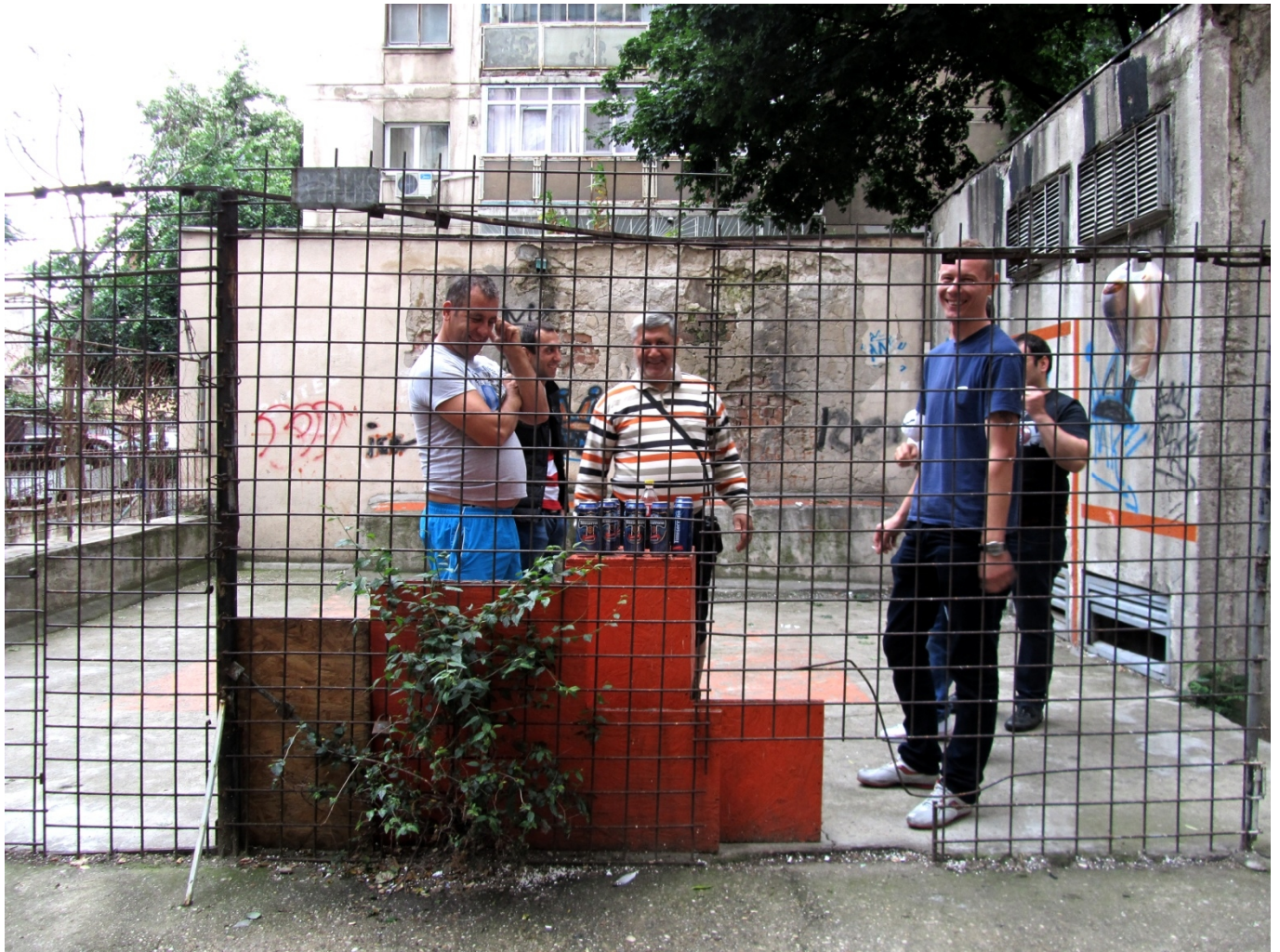
Magic Blocks, 2014