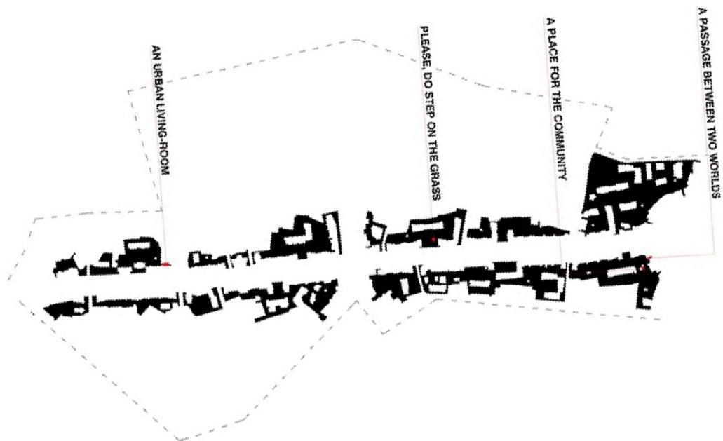
Magic Blocks helyszínrajz, beavatkozások helye