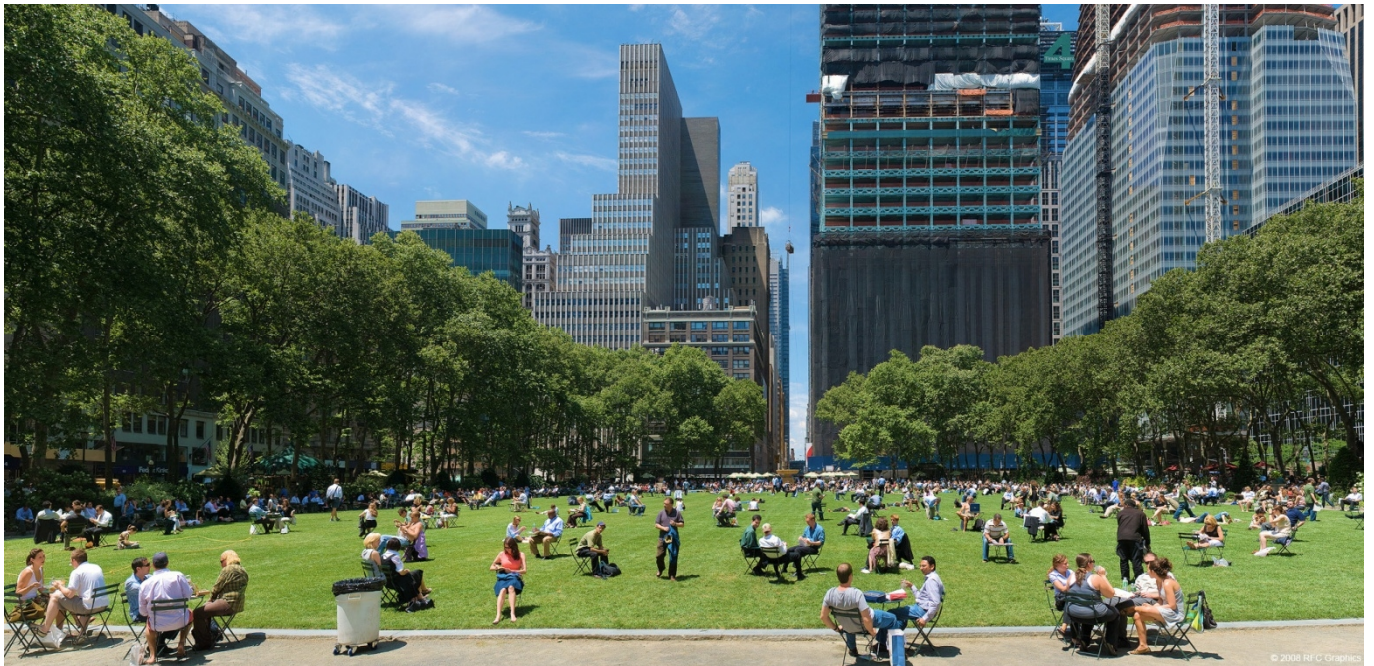
Bryant Park