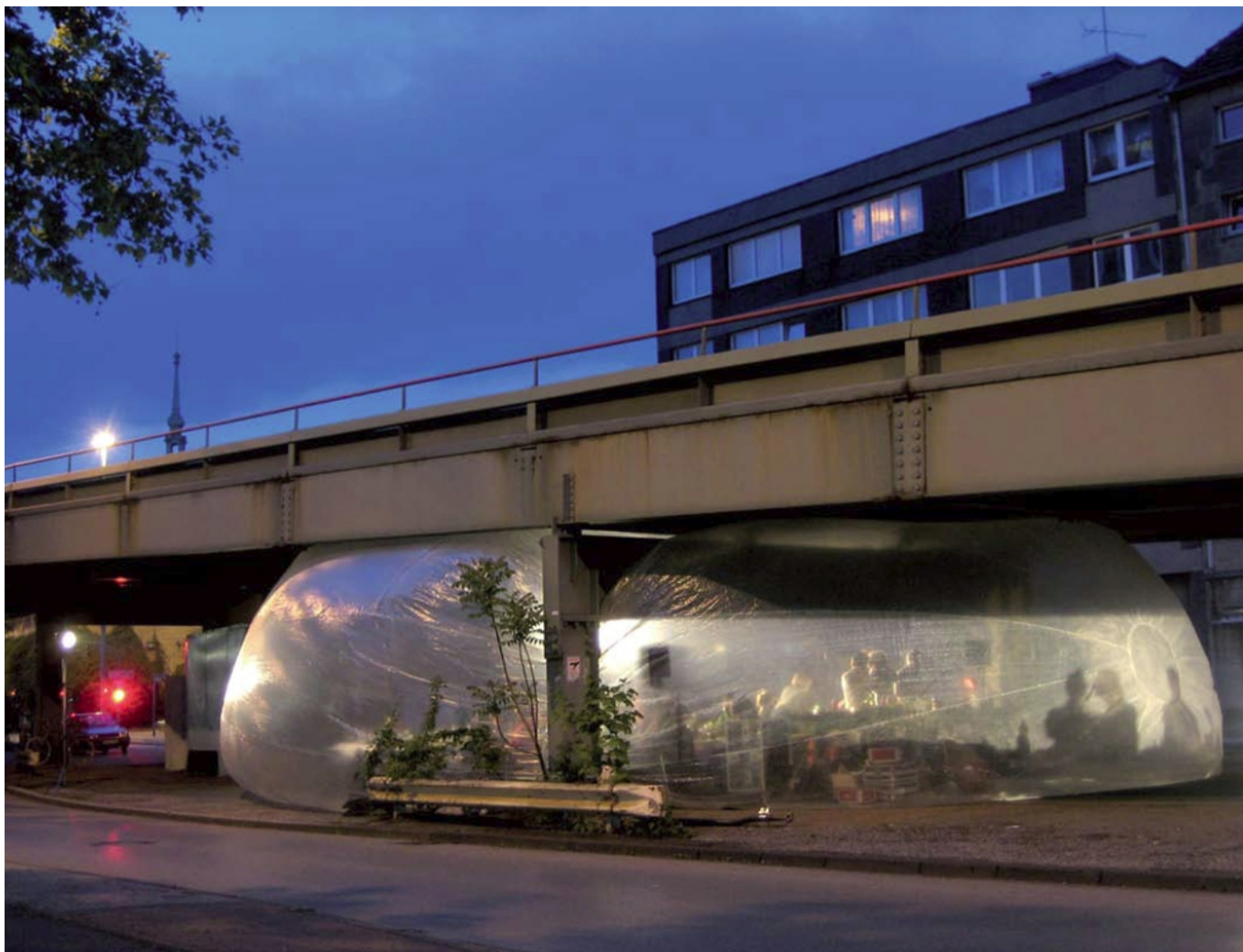
Spacebuster, Raumlabor

foglalkozni (pl. EXYZT, TXP). Sőt már kifejezetten ilyen programokat szervező városi fesztiválok is működnek (pl. 72HOURS), ahol nemzetközi csapatok néhány nap alatt lokális problémára akciószerű válaszokkal reagálnak, installációkat építenek. A kérdés az, hogy mennyire lehet hiteles ez a működés? A karakterükből adódóan nagyon hasonló fizikai eszközrendszerrel dolgozó aktivista csoportok jelenléte milyen szerepet tölthet be a város életében? A látszólag hasonló fizikai eredmények mögött nagyon különböző motiváció, felkészültség és előkészítettség áll.