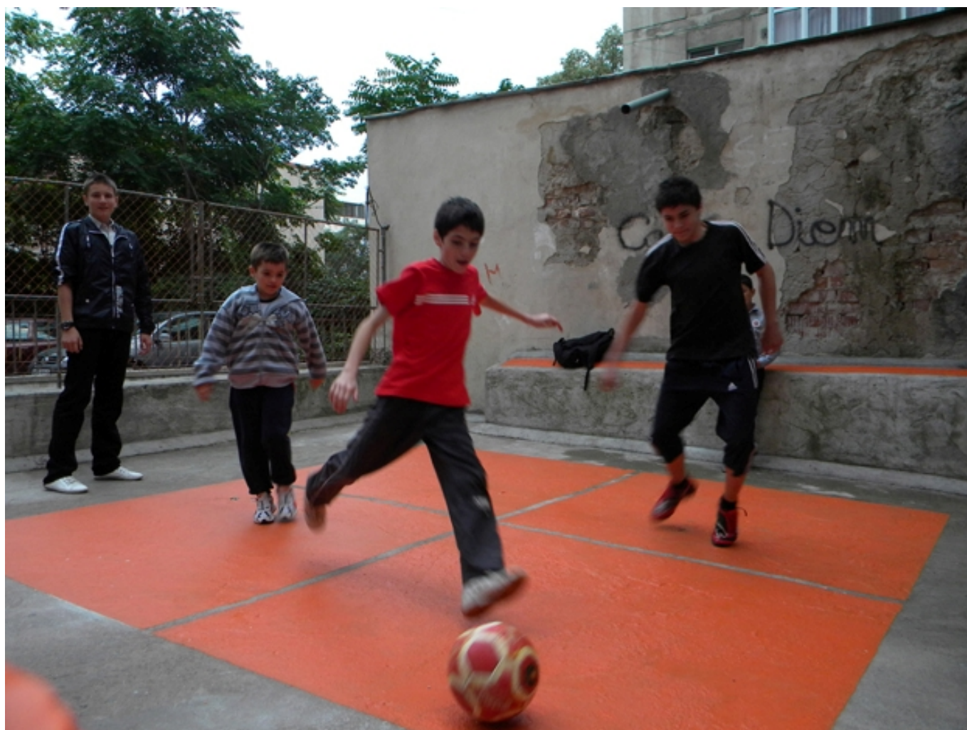
Magic Blocks átadásakor, 2010