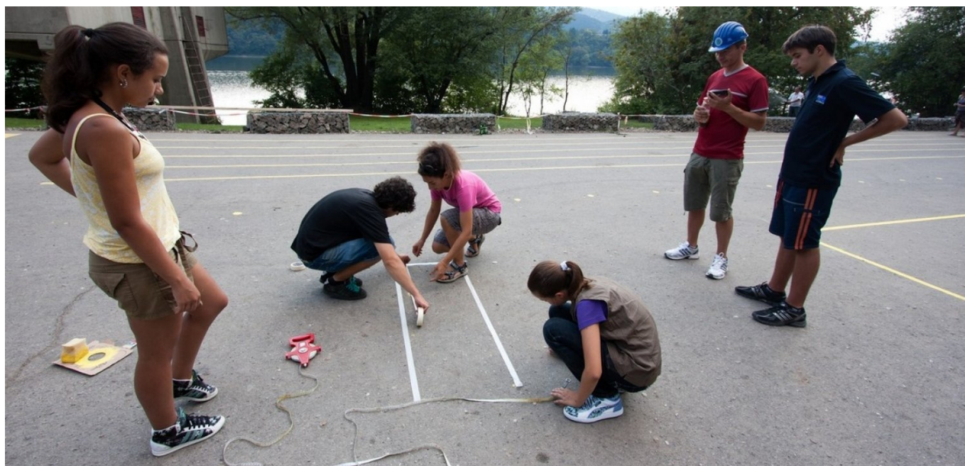
TabloID workshop