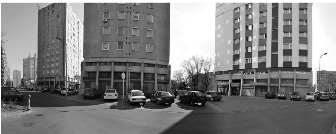
A tömbházak emberi nézőpontból – „áramló tér”

A magasházak nem csak embertársainkkal való kapcsolat minőségére hatnak ki, hatásuk ember környezet relációban is jelentős: a magassággal a lakók elveszítették közvetlen kontrollt környezetük felett és magatehetetlen szemlélői az eseményeknek. A modernizmus rámutatott, hogyan kell sok lakót kis területen elhelyezni, miközben a levegős, napfényes otthonok iránti vágyról sem kell lemondanunk, ugyanakkor a magasházak építésével nyert, lakóközösségeknek szánt zöldfelületeket, senki sem érezte sajátjának, azok gyorsan degradálódtak. 17