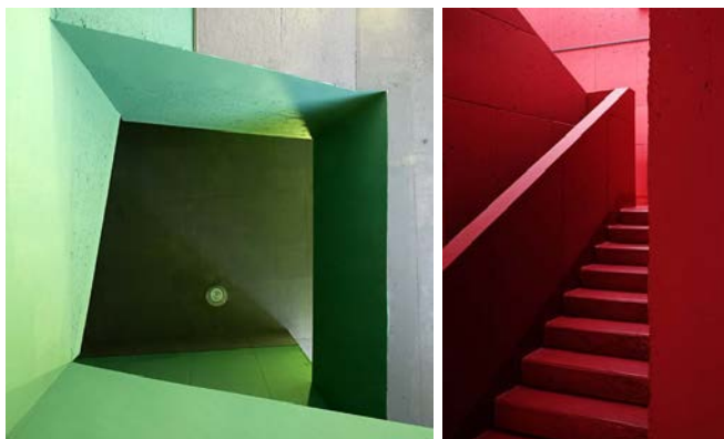
Kesztyűgyár közösségi ház