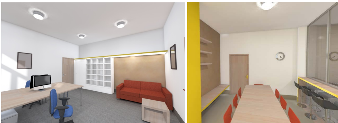
Látványtervek: iroda, közös étkező

A védett tér olyan kontrollálható, a közösség fizikai- és szociológiai struktúrálási elvén alapuló szociofizikai környezetet jelent, mely a biztonságérzet megteremtésén keresztül képes pozitívan befolyásolni a benne tartózkodók érzelmi állapotát, így hozzájárulva a nyitott (belső) védettséghez. Az egyének a fizikai környezetük és társadalmi interakcióik feletti kontroll gyakorlásán keresztül képesek szabályozni az őket érő ingerek minőségét és mennyiségét, a folyamatos készenlét feletti kényszer enyhül, ami utat nyit a lelki feltöltődés előtt.