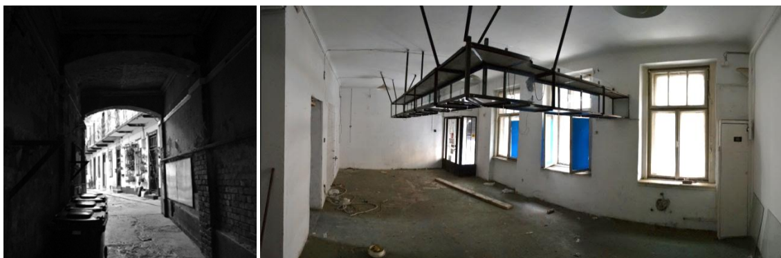
A kirekesztett nők menedékhelyéül szolgáló intézmény jelenlegi állap

Az előtérrel szemközti kis irodákban a nők személyes problémáikat tudják négyszemközt megbeszélni egy szakemberrel. Mellette található a konyha. A kényelmesebb felszolgálás érdekében egy kis ablakon keresztül lehet kiadni az ételt. A hátsó szárnyban 2 (+1) munkahelyet alakítottunk ki. A hátsó szárnyban elhelyezett vizesblokk a szociális munkásokhoz tartozik ugyan, de „felügyelettel” azt a célszemélyek is használhatják, le tudnak zuhanyozni, át tudnak öltözni.