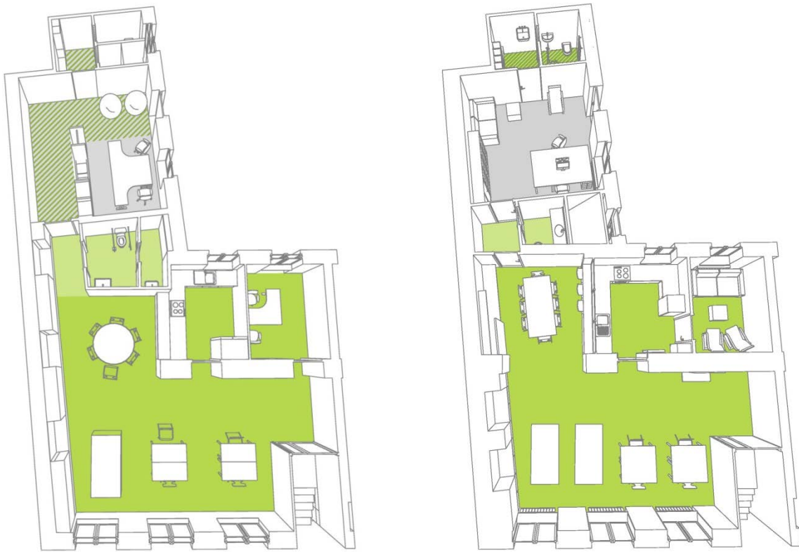
A tervek fejlődése a lehetőségek függvényében – két kiragadott példa