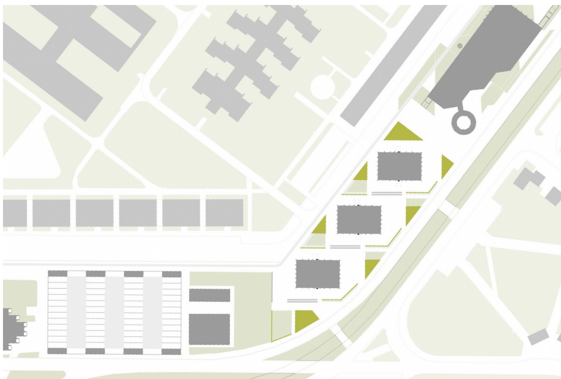
A lineáris városközpont „láncszemei” balról jobbra: őstermelői piac (tervezett), védett közösségi terek a magasházak körül (saját terv), „spirálház” (tervezett kiegészítés)

Újpalotán a városközpontból kivezető Drégelyvár, majd a ferdeszögben megtörő Nyírpalota utca az egyik főtengely, a keresztirányú forgalmat vezető Páskomliget és Zsókovári utca a másik. Ezeket az útvonalakat kísérik a párhuzamos sávházak vagy ferdeszögben eltolt tömbházak, többé-kevésbé zárt utcaképet alkotva. Az inflexiós pontokba szoborszerűen megformált toronyházakat szántak. Az X alakú tengelykereszt „fala” négy negyedre osztja, ahol a további épületeket egy-egy alközpontba, „szomszédsági egységekbe” tömörítették a tervezők. A lineáris városközpont egy képzeletbeli sáv, ami a Zsókovári utcai orvosi rendelőtől a „tengelykereszt” metszéspontjában található tömbházakon át a Nyírpalota utca túloldalán található Vásárcsarnokig tart. A Zsókovári utca túloldalán található a Újpalota Fő tere, melyet a rajta lévő közösségi házzal együtt a tervek szerint hamarosan megújítanak.