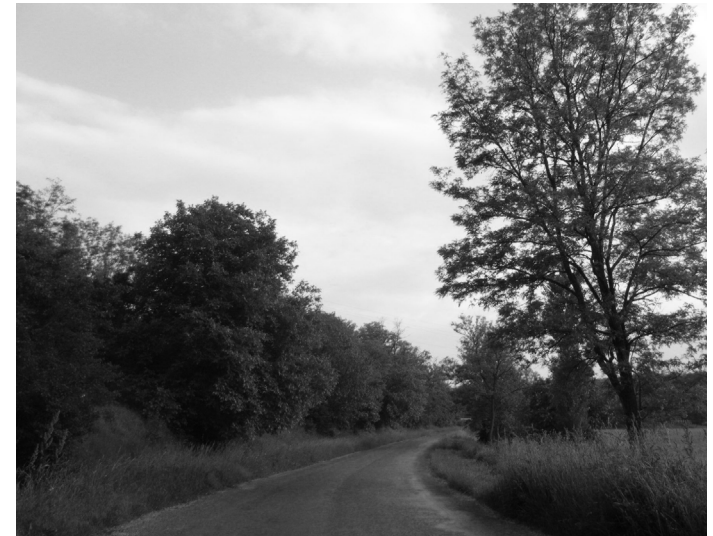
Bekötőút Ságvárról Nyim felé

Nyim az 1960-as évekig rendkívül alacsony infrastrukturális adottságokkal rendelkezett. Bár az úthálózatának és falu szerkezetének jelentős része (főleg a patak nyugati oldalán) már a 2. katonai felmérés tanúsága szerint kiépült a 18. század végére, csak a hatvanas évek előttre (valószínűleg a II. világháború előtt) készült el a bekötő úton a Nyim-patak hídja, és a falu központjában álló híd. A bekötőút szilárd burkolata vélhetően az '50-60-as években készült el a faluháza előtti teresedésig, illetve ugyanebben az időszakban alakították ki a TSZ majorhoz vezető vasbeton