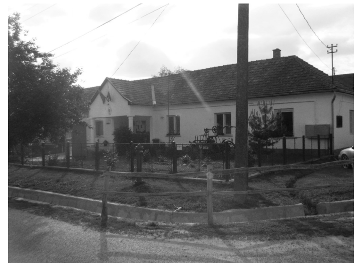
Az Önkormányzat épülete

A használati funkcióval bíró épületek és terek összessége, a középületek és közterek a valós-teret markánsan kifizető elemei. A közösség által használt terek az emberek jelenléte miatt, és az emberek mentális térképén elfoglalt kitüntetett pozíciójának köszönhetően jelölnek ki kiemelt jelentőségű pontokat Nyim valós-terében. A pontokhoz közösségi funkciók tartoznak. Ilyen közösségi funkcióval bíró közterek a régi és az új temető, a játszótér és az emlékművek terei, az 56-os emlékmű, a Szent István és a Petőfi szobor. Közösséghez szorosan kapcsolódó középületek elsősorban a kultúr épülete, benne a bolttal, kocsmával rendezvénytérrel és a köz WC-vel, illetve a vele szemben álló polgármesteri hivatal épülete a könyvtárral és a polgármesteri irodával.