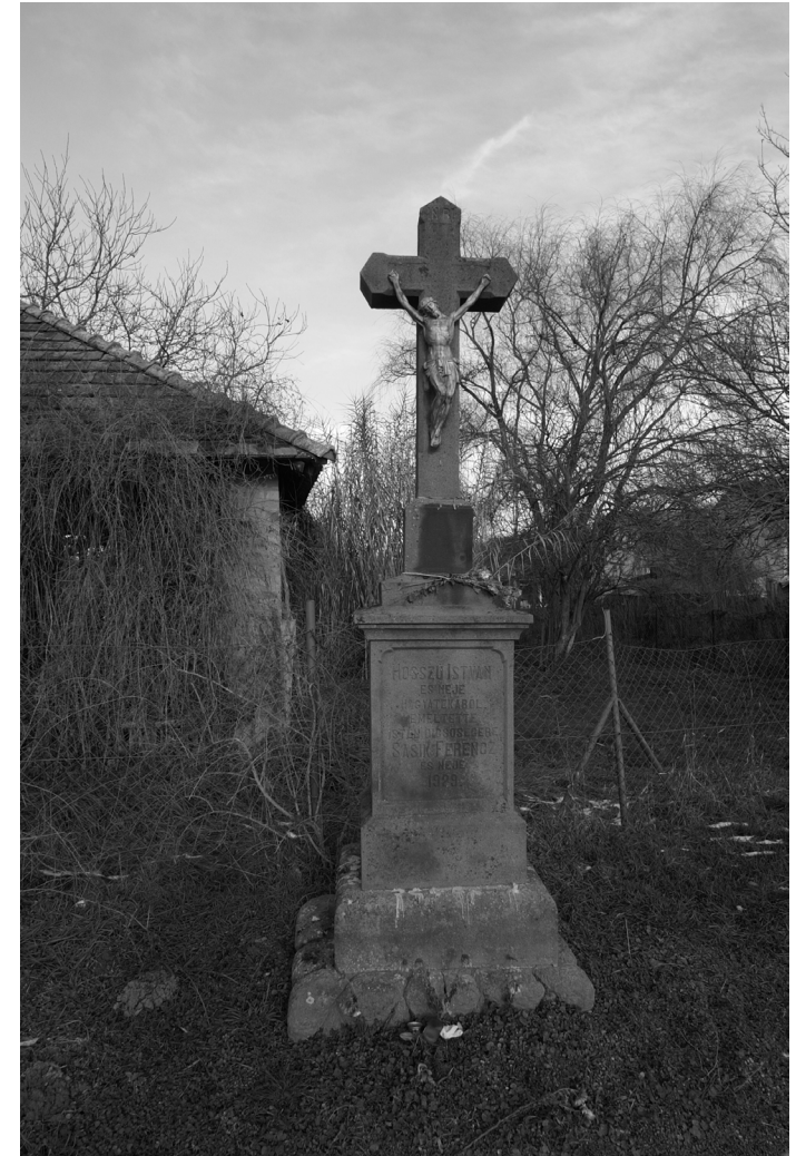
Kereszt a faluközponban 1929-ből

A lakóházak és gazdasági-, melléképületek és kocsiszínek teljes jegyzékét lásd az értékkataszterben.