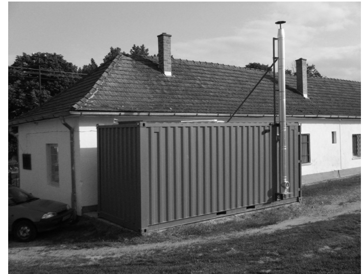
Biokazán az önkormányzat épülete mögött

A beépítés jellemzően (néhány kortárs kivételtől eltekintve) oldalhatáron álló, változó előkerttel, vagy anélküli. Nyim egyes pontjain párhuzamos telepítésű ház is megjelenik, (3 esetben) azonban ezek ritka kivételeknek tekinthetők. A szabadon álló házak a legújabb beépítés esetén jöttek létre, ebben az esetben többször előfordult az, hogy a régi lakóépület mögött sorakozó gazdasági épületek helyére építették az új lakóépületet, majd a régit elbontották (Petőfi utca).