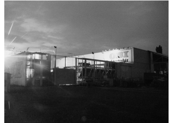
Balatonkiliti bevásárló komplexum

A fenti csoportosítás eredményeként különböző minőségű és típusú objektumokat magába foglaló jegyzéket kapunk. A jegyzék objektumainak különböző szempontok szerinti újrendszerezésével kíséreljük meg a falu térhasználatának az idő kezelésével kapcsolatban álló viszonyait felfejteni és megvizsgálni.