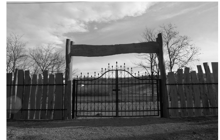
Az új temető kapuja