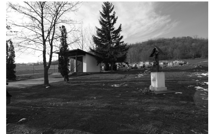
Ravatalozó és kereszt az új temetőben

A temető a halottak földbe helyezésére szolgáló földterület, mely a faluhoz képesti helyzetét és használatának a módját a történelem során többször megváltoztatta. Az Árpád-korban a gyakran temetkeztek a fallal körbezárt templom kertjébe. Ez a temetkezési forma a hely szűke miatt megszűnt, az újabb temetőt a falu belterületén belül jelölték ki. Azt a falu idővel körbenőtte, így újabb temető megnyitására volt szükség. Így megindult a temetők falu belsejéből való kifelé vándorlása, ami a mai napig is tart. Gyakran a temetők hagyományos építészeti tartozékai voltak a temetőkápolna és a kálvária is a közelben épült.