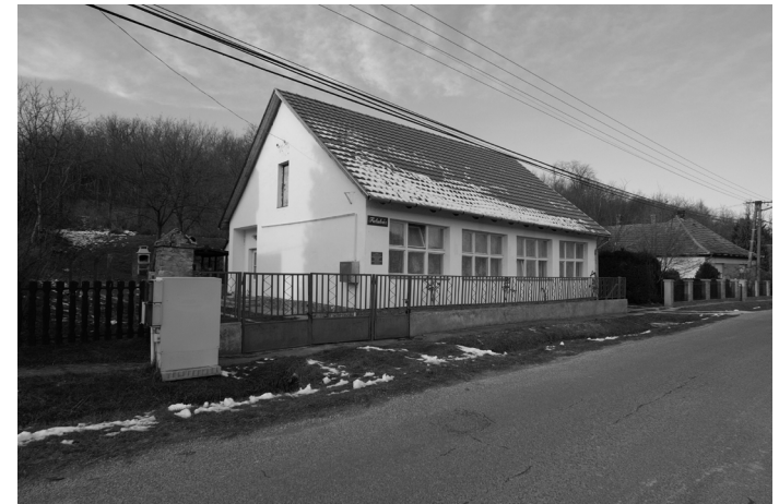
Egykori elemi iskola, ma Faluház