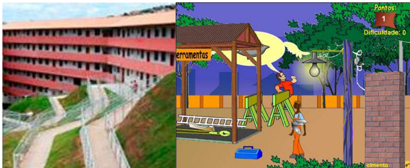
kép09 | kép10