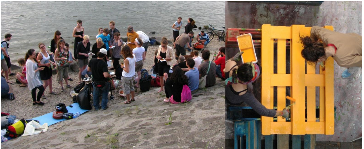
kép15 | kép16