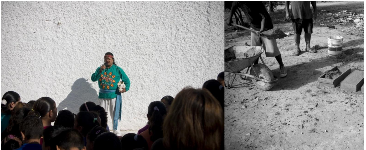
kép11 | kép12