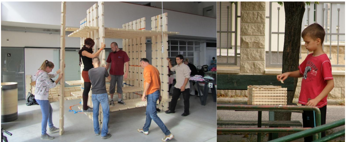
kép13 | kép14