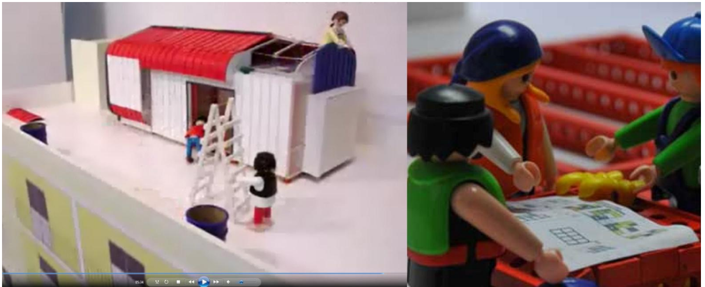
kép01 | kép02

A tervezett építmények kivitelezési terveit képregényben megfogalmazott összeszerelési útmutató kísérte (kép03). Bennük fel volt tüntetve az elvégzendő munkafázis, a felhasznált anyagok, a szükséges emberek száma, a munkavédelmi felszerelés, a szerszámok, a részletesen bemutatott munkafolyamatok a munkavédelmi figyelmeztetésekkel és balesetveszélyes helyzetek kiemelésével. A rajzos dokumentáció aktívan segítette a résztvevőket a kivitelezés részleteinek megértésében és a technikák elsajátításában. A munkákat irányító építész személyes felelőssége megsokszorozódott a terepen, a résztvevők testi épségének megóvása kiemelt szempont volt. Az építkezésekről részletes videós és fotós dokumentáció készült, hogy tapasztalatul szolgáljanak a jövőbeli folyamatokhoz.