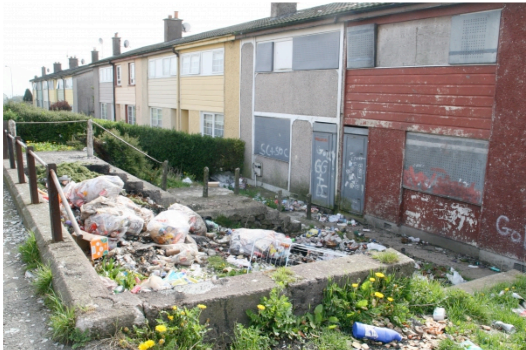
Cork, Írország, Council's Housing