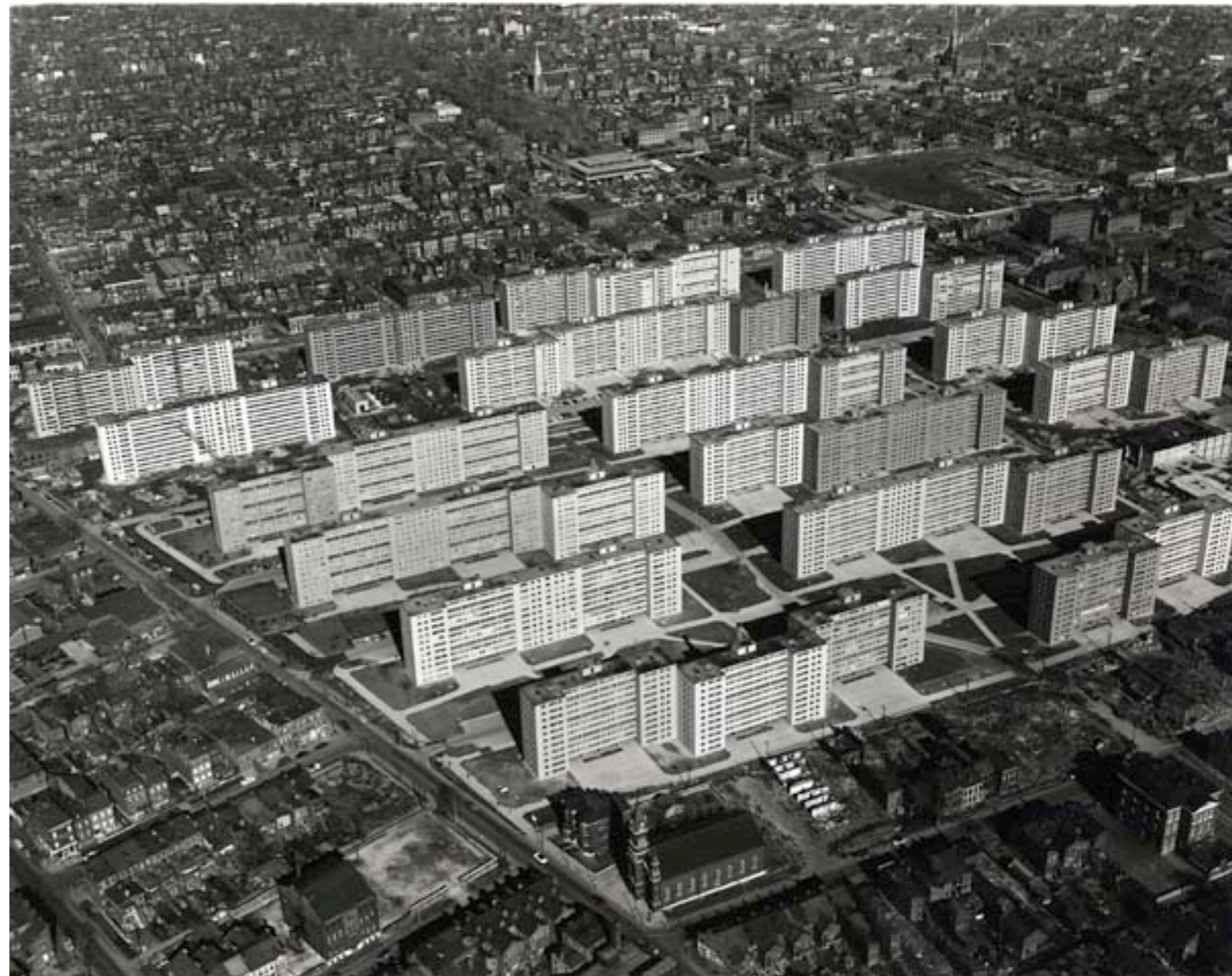
Pruitt-Igoe, St. Louise, Missouri

Greenhalgh, P (1990) Modernism in Design, Henket, H,J. (2002). Modernity, Modernism and the Modern Movement