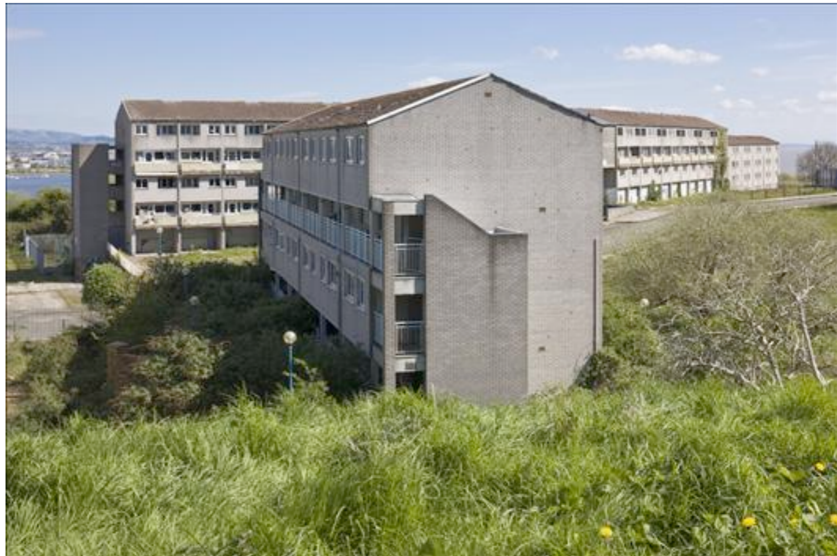
The Billybanks – Penarth, Cardiff