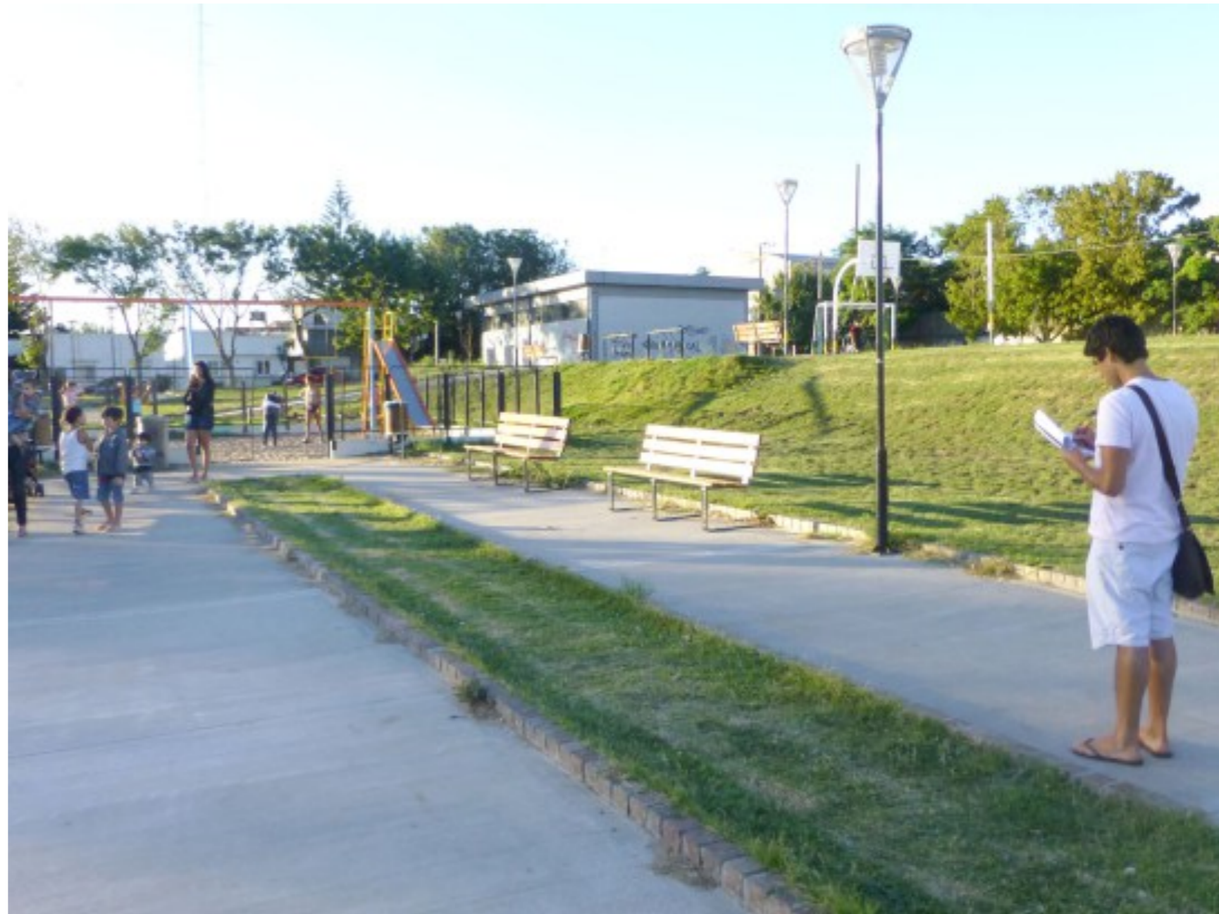
Mar del Plata, Argentina