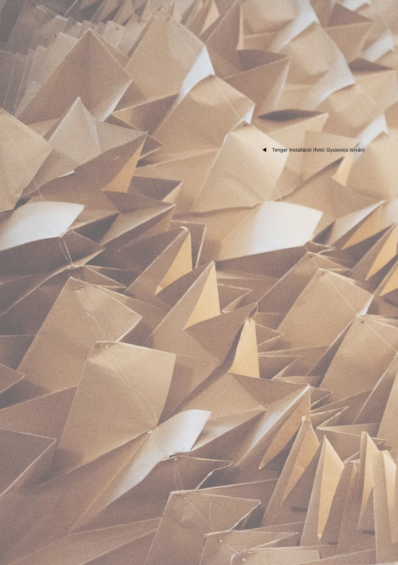
◀ Tenger installáció