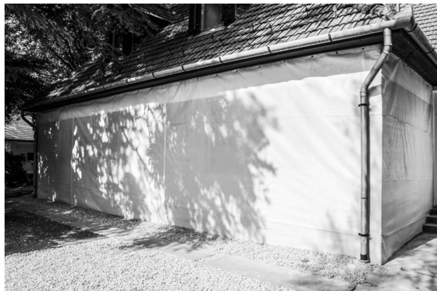
Arkt Művészeti Ellátó Eger, 2013-2015