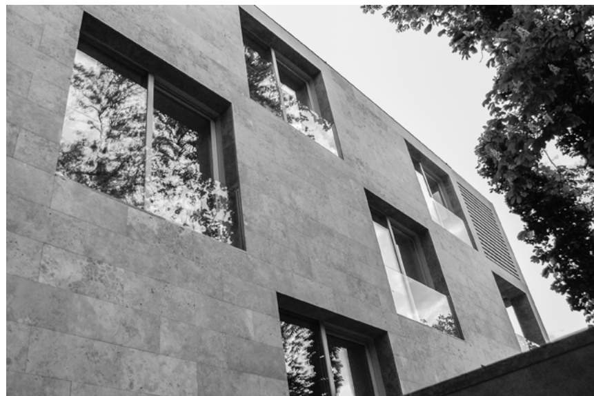
Négylakásos társasház Budapest, 2009