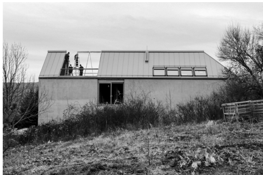
Családi ház Felsőtárkány, 2011