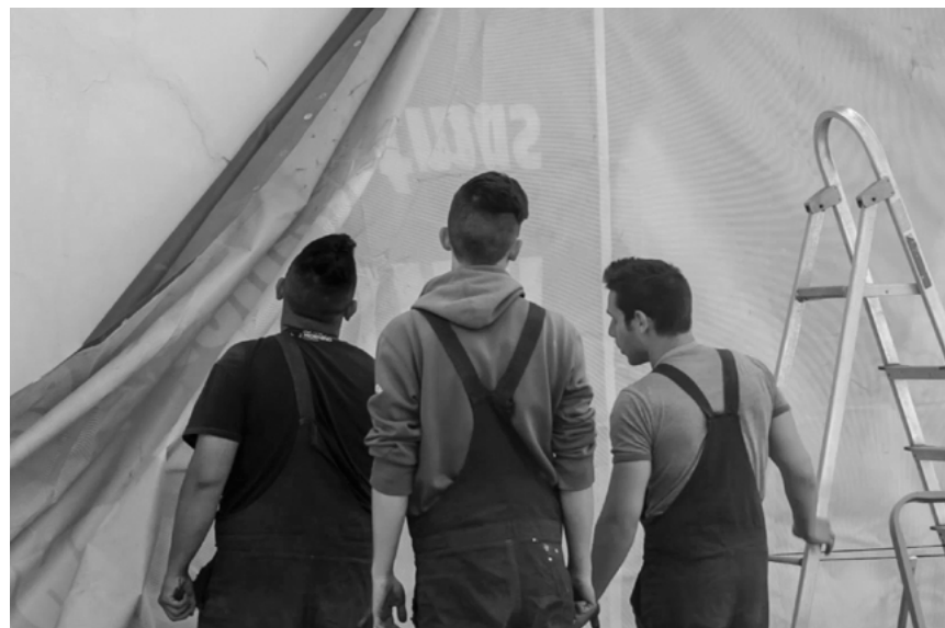
Arkt Művészeti Ellátó Eger, 2013-2015