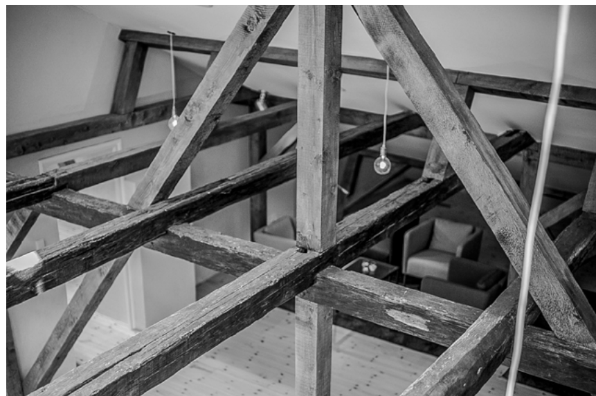
Fúzió - Gál Tibor Pincészet Eger, 2011