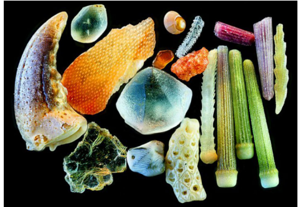
Yanping Wang : Beijing Planetarium: Homokszemek Nikon's Small word, 2010

Az élethez számos természetes szállal kapcsolódó építészeti gondolkodás az a közös alap, melynek egyenes következménye a példaként bemutatott házakra jellemző építészeti minőség. Ennek tanulságait más épületefajták tervezésénél, sőt az építészeti képzésben is lehet hasznosítani. A borászatok pedig megnövekedett marketing szerepüknel fogva kaput nyitnak a tervezői gondolatok és a szakmán kívüli közönség összekapcsolásához is.