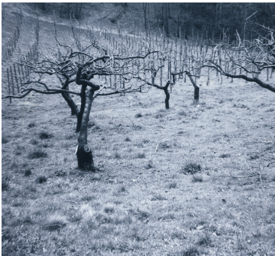
Ausztria, Silberberg Az első dűlő ahova borászatot terveztem