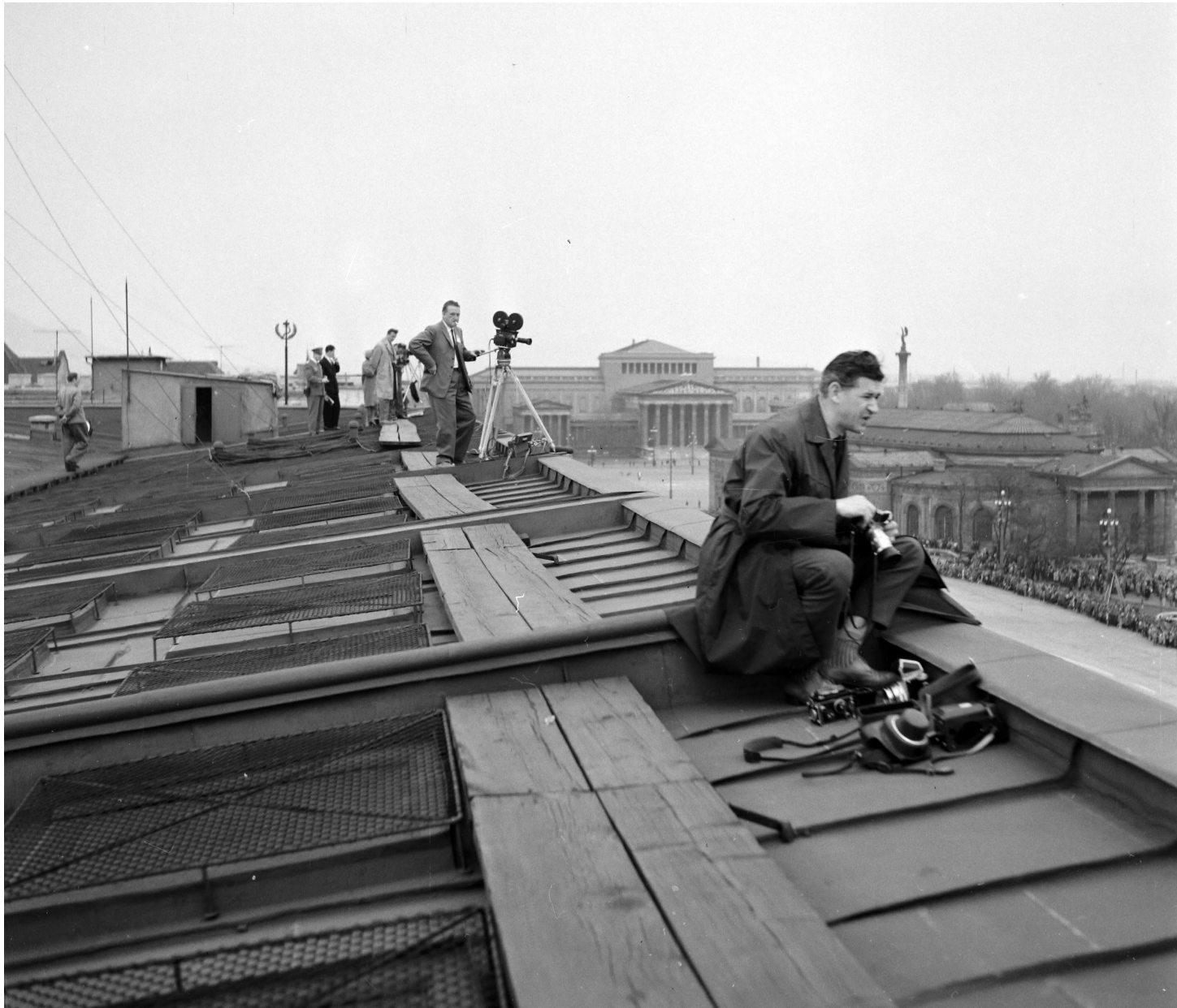
Városligeti fasor > Andrásy út - Hősök tere > Felvonulási tér > Városligeti fasor