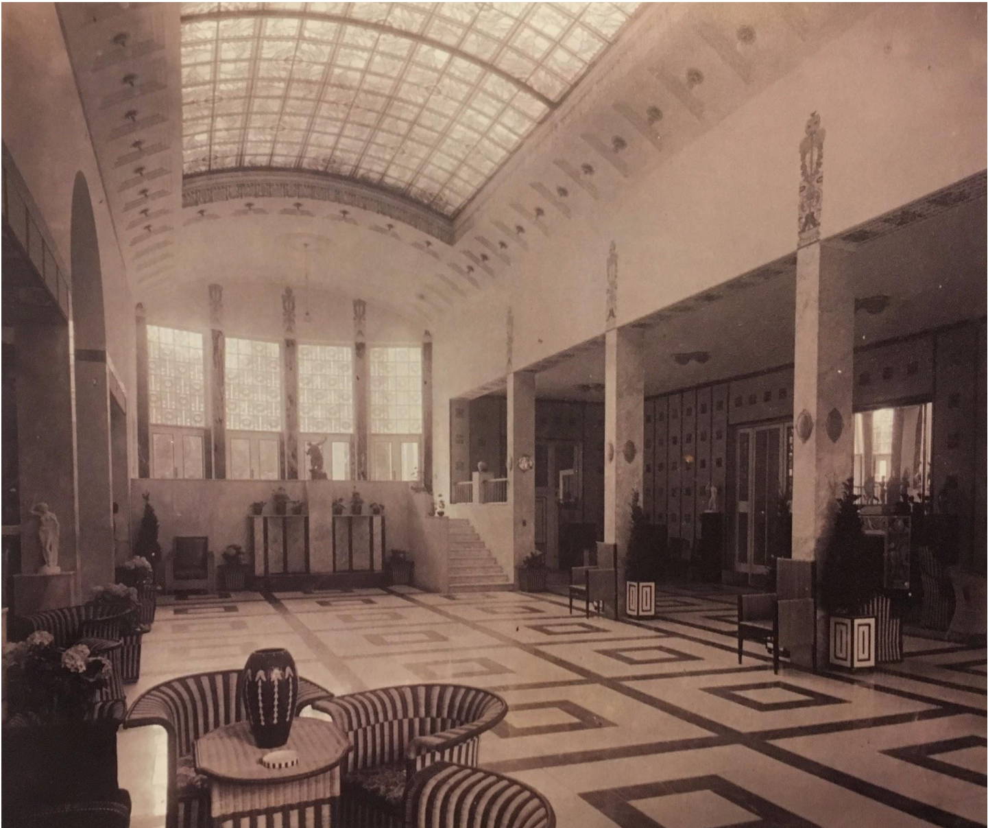
Lipótvárosi Kaszinó, 1912