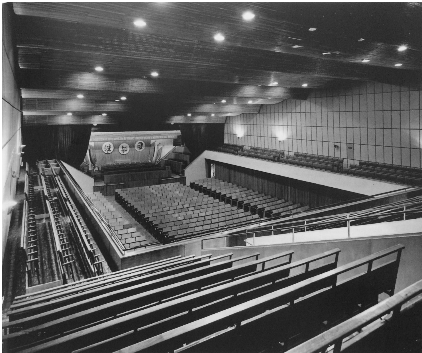
MÉMOSZ kongresszusi terem, Építők Rózsa Ferenc Kultúrháza