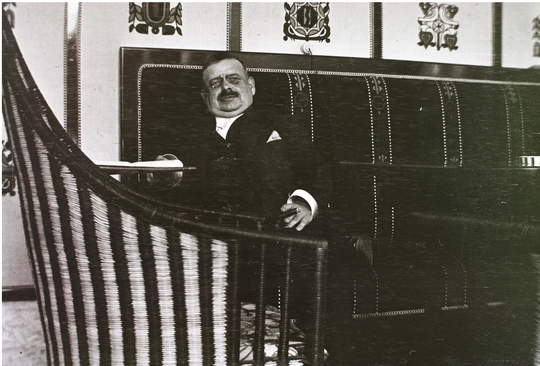
Lipótvárosi Kaszinó, 1912