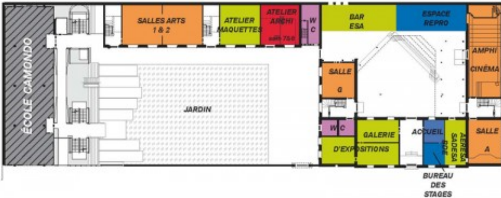
Ancien bâtiment - Rez-de-Chaussée