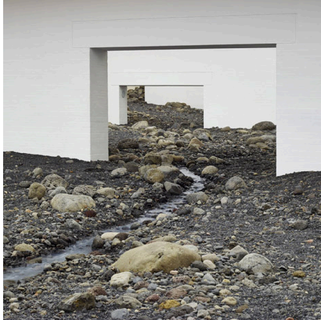
barlang Olafur Eliasson Riverbed 2014