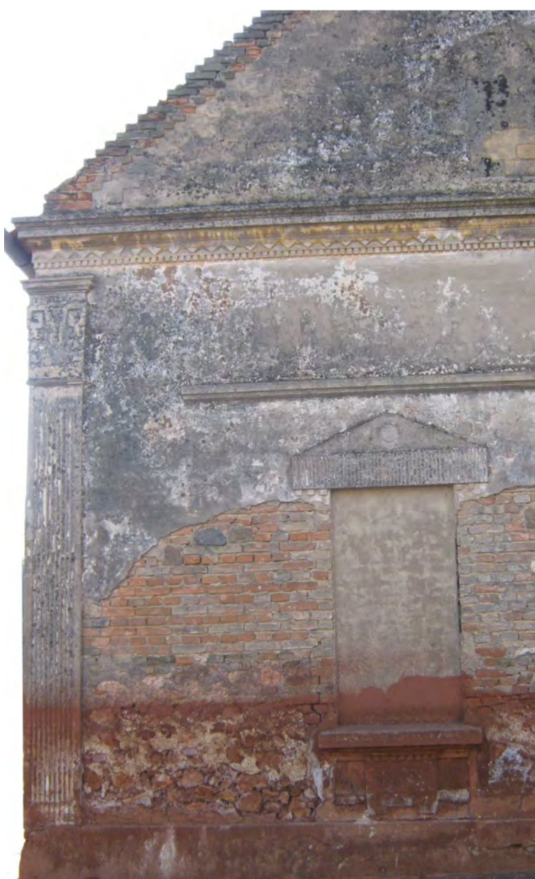
műemlék épület "zsidóház"