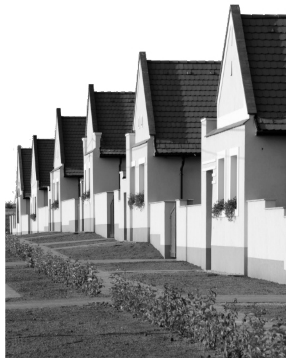
új családi házak