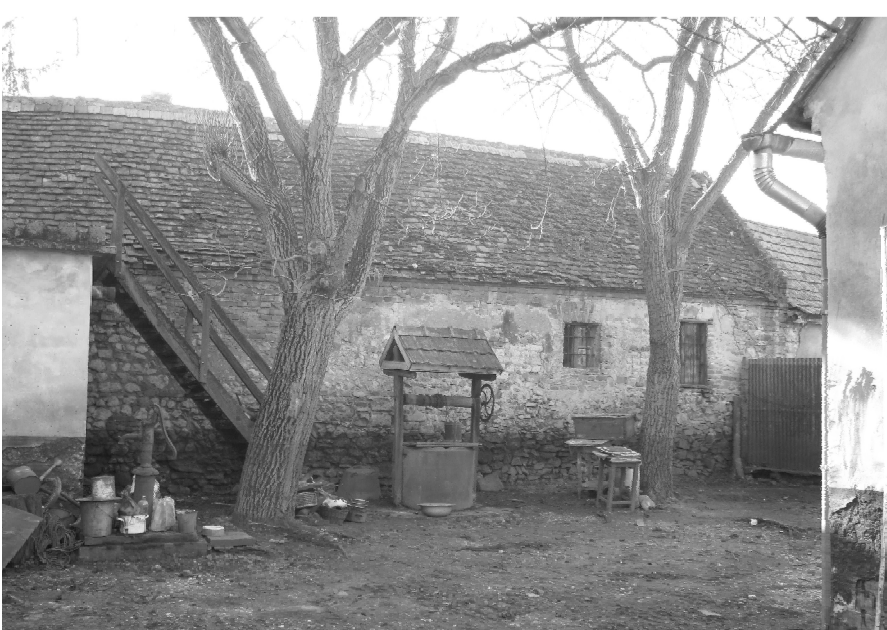
régi belső udvar