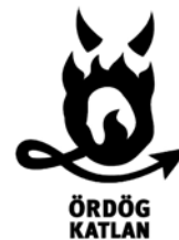
Ördögkatlan – Nagyharsány, Kisharsány, Palkonya (Ördögkatlan Fesztivál Egyesület)