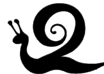
Művészetek völgye – Öcs, Kapolcs, Monostorapáti, Nagyvázsony, Pula, Taliándörögd, Vígándpetend (Kapolcsi Kulturális és Természetvédelmi Egyesület)