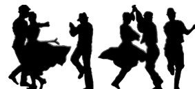
Kiscsősi Pajtafesztivál – Kiscsősz (Apte Művészeti Egyesület)