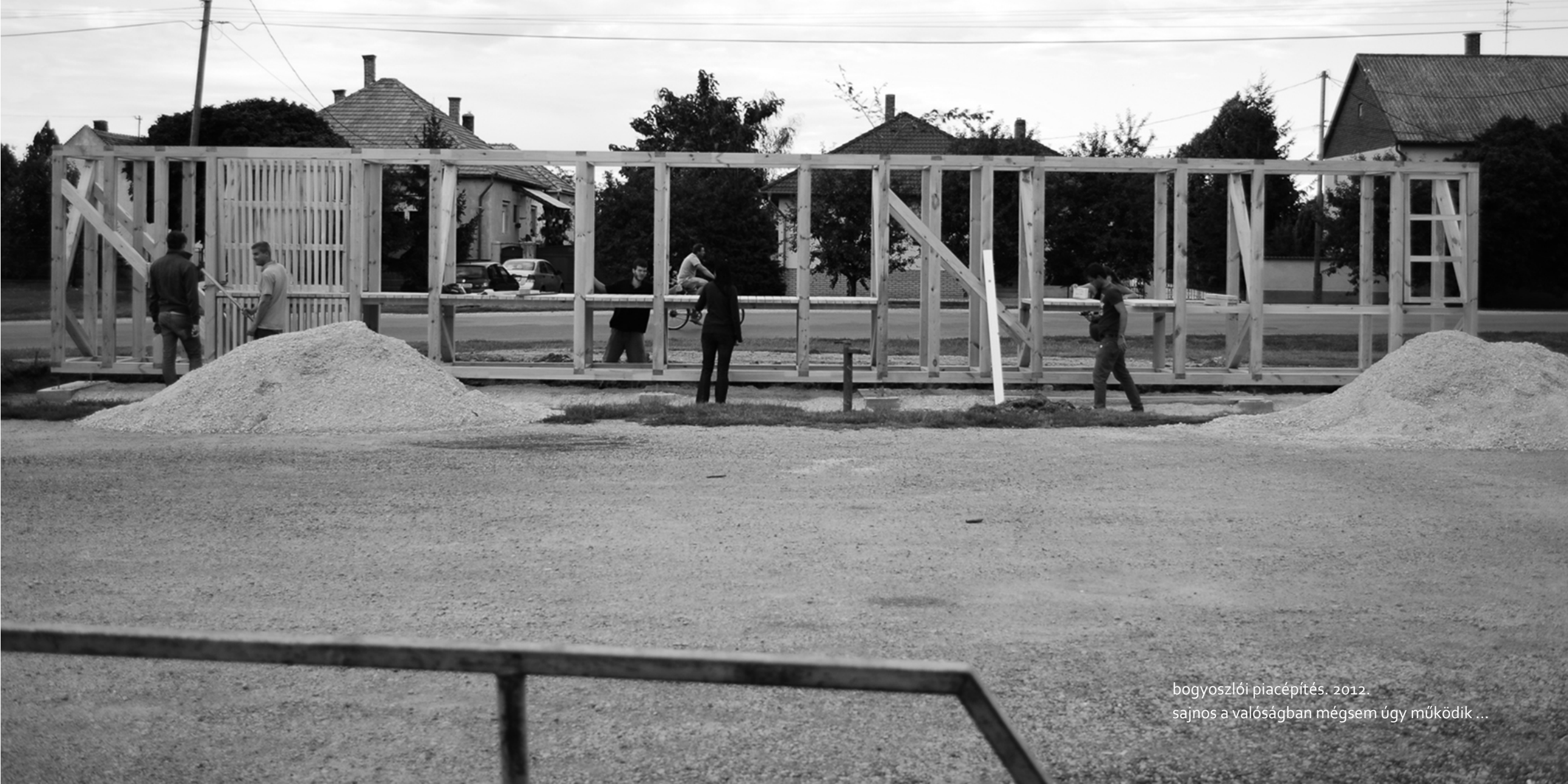
bogozslói piacépítés. 2012. sajnos a valóságban mégsem úgy működik ...