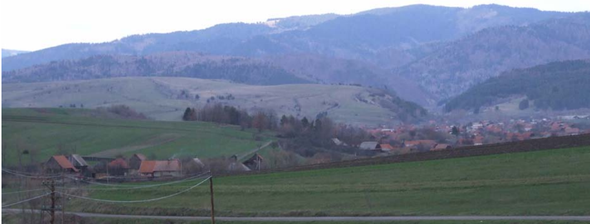
1. kép: Kászontáiz, táj- és településszerkezet

Ma a falukép kaotikus képet mutat. Ennek okai az elmúlt két évtizedben megváltozott gazdasági helyzet és életmód. Azelőtt mintegy skanzenszerű állapotban őrződött meg a hagyományos falukép. Mindez szükségessé teszi a térség átgondolt, stratégiába foglalt építészeti fejlesztésének lehetőségét.