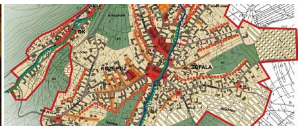
3. kép: Szabályozás, Kápolnás falu