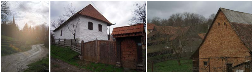
4-6. kép: Énlaka, védett faluszerkezet

A fejlesztési terv 3 elemei a tudatosan racionalizált telekhasználat, a meglévő házak fejlesztésére adott javaslatok, a hagyományok pozitívumait felhasználó új házak tervei, a szelíd energiatermelési technológiák, stb. A tanulmány javasolja a telepítési-, telek-beosztási struktúrák megtartását, a funkciók tudatos csoportosításával, megtartva a kapcsolatot a környező gazdálkodási terek felé. A hagyományos építési technológiák megismertetését, építőanyagok forgalmazását, bontott anyagok raktározását biztosító épületek/szaktanácsadó műhelyek kialakítását. A házak korszerűsítése hosszanti irányban történő bővítéssel az udvar irányába, vagy hátrafelé képzelhető el, megtartva a hagyományos formát.