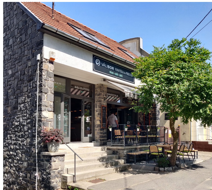
Válibor Vinotéka és Apartman, Badacsonytomaj, Hősök tere 11. – 2021