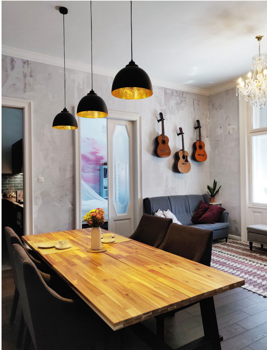
Belvárosi lakás átalakítása, Budapest, IX. – 2020