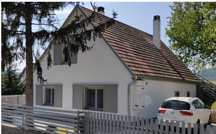
Válibor Vendégház és dolgozói szállás, Badacsonyörs, Major út 58. – 2019