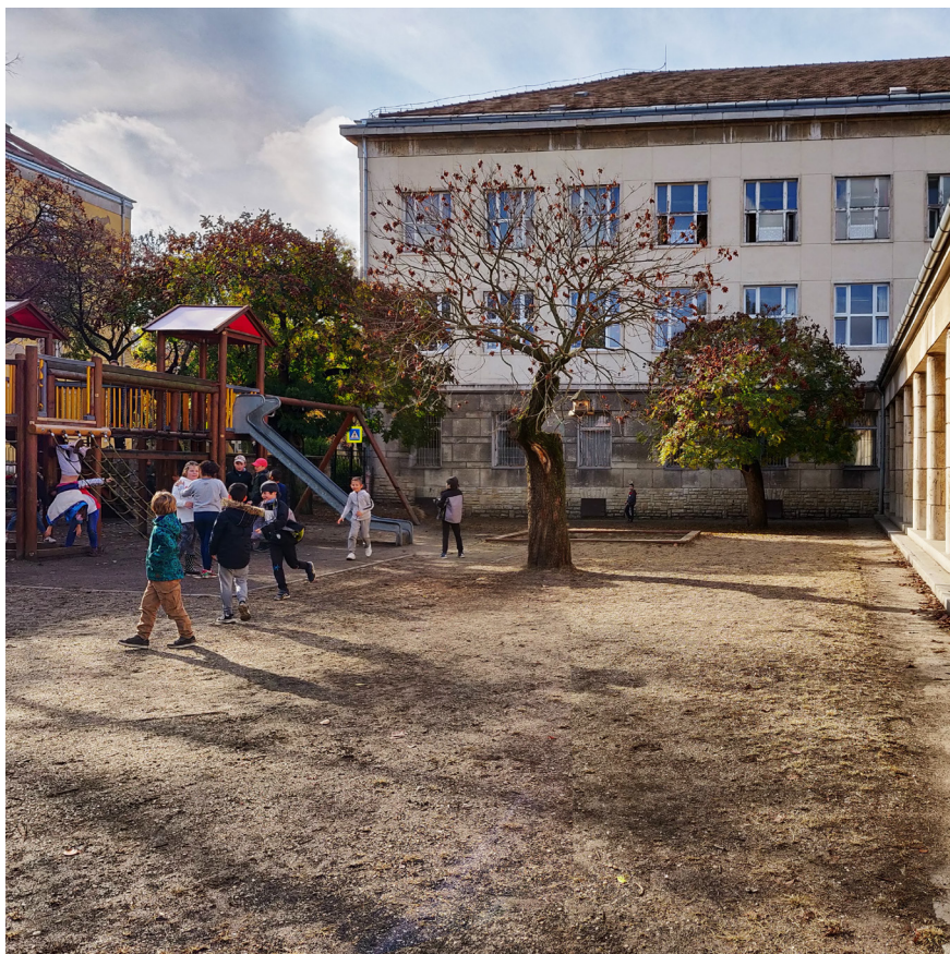
A használat megfigyelése, Zuglói Heltai Gáspár Általános Iskola – 2019. november