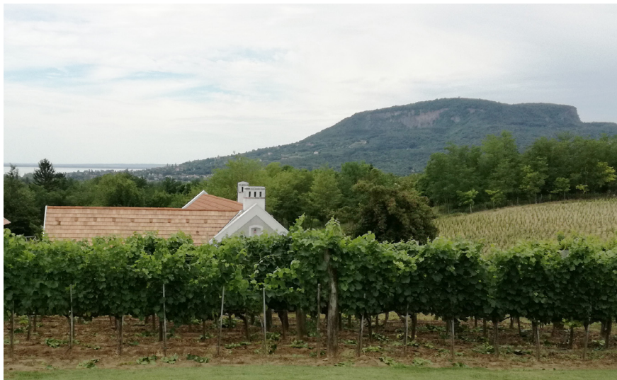
Válibor Fogadó és vendégház, Badacsonyörs, Major út 42. – 2017