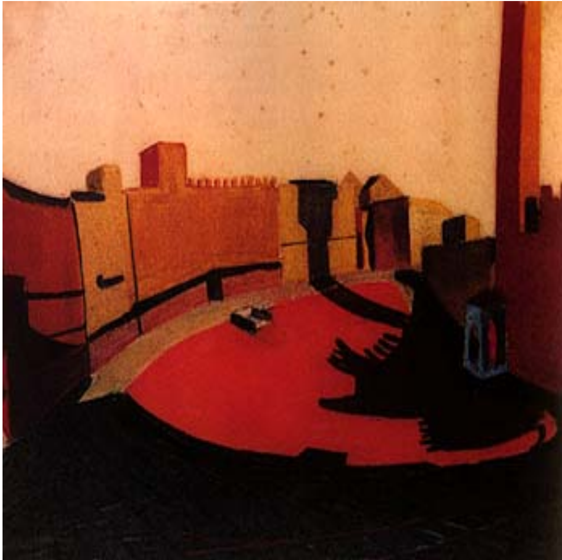
Louis I Kahn - útirajz, pasztel Siena, Olaszország 1951

E tanulmány szintetizáló törekvéseit elméleti megközelítések sora előzte meg, melyeket nem felülről, hanem aktualizálni szeretne. A tanulmány módszertani megközelítése ugyanazt a folytonossági elvet vallja a kutatás elméleti konstrukciójában, mint az épített környezet kapcsán: minden építés hozzáépítés 60