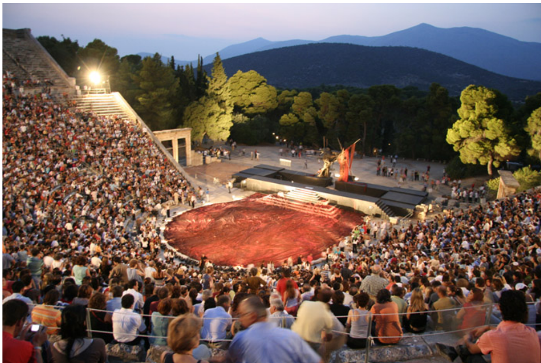
Színház, Epidauros k.e. 300

Miért jó, hogy egy újabb fogalmat vezetünk be? Mert megnevezésével önmagába sűríti a mögötte lévő csupán hosszasan körbeírható jelenséget, így gondolatilag kezelhetőbbé, megragadhatóbbá válik. Márpedig gondolkodásunkra a beszéd, mint kommunikációs eszköz nyilvánvalóan visszahat; a sűrű üres térként címkézett fogalom könnyebben összeáll gondolati sémává, egyúttal érthetővé. A könnyebben érthető gondolati séma, mint kommunikációs árok vezeti meg gondolkodásunkat. Mikor benne vagyunk a gondolatmenetben, nagyon nehéz egyik árokból a másikba ugrani, ezért egy építészeti koncepcióalkotás kezdetén érdemes a viszonyítási alapot megfelelően kiválasztani. Jelen tanulmány a sűrű üres tér jelentőségét hangsúlyozza, mint koncepcionális alapvetést, elsődleges szerepű értékhordozót.