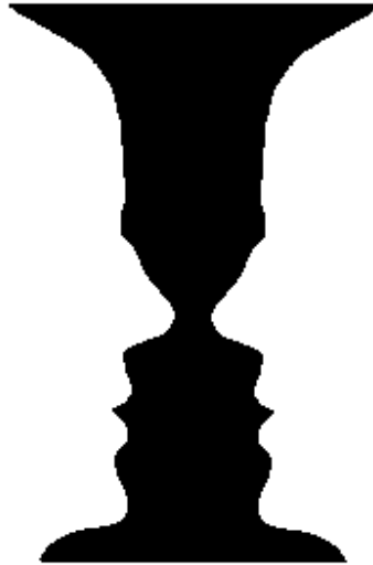
figura és háttér

Az inverz gondolkodás az építészetben olyan szemléletmód, ahol egyaránt fontos szerepet tulajdonítunk az épített környezet elsőre szembeötlő elemének - a figurának - és érzékelésünk azon részének, melyet elsőre nem veszünk észre - a háttérnek, de nem síkban, hanem térben és időben gondolkodva.