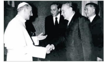
VI. Pál pápa fogadja Kádár Jánost a Vatikánban 1977. június 9-én