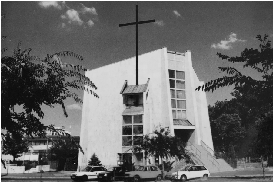
Budapest-Vizafogói Tours-i Szent Márton templom - nyugati homlokzat 1995

A megvalósult épület, mint kézzel fogható eredmény mellett háttérbe szorulnak és sokszor feledésbe is merülnek az annak létrehozását befolyásoló folyamatok és körülmények. Az épület létrejöttének ilyen mélységű dokumentálása és annak megismerése nagyban segíti a megvalósult épület pontosabb megértését és megítélését és nem utolsósorban az építész lehetőségeinek, dilemmáinak és ezzel a szakmai játékterének megértését is.