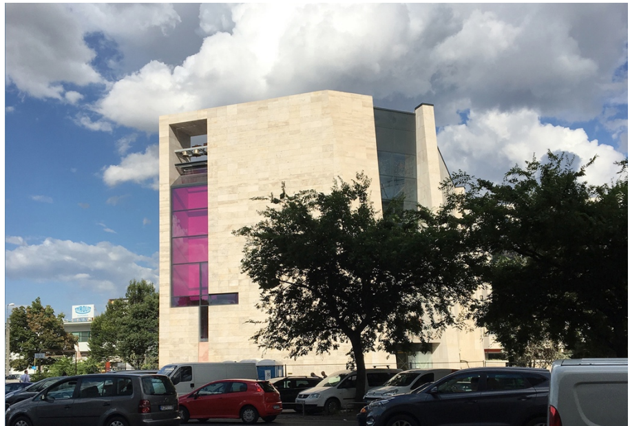
Budapest-Vízafogói Tours-i Szent Márton templom - nyugati homlokzat 2017

Az ezek okozta hatás, így az eredeti tervezési idea változása folyamatos.