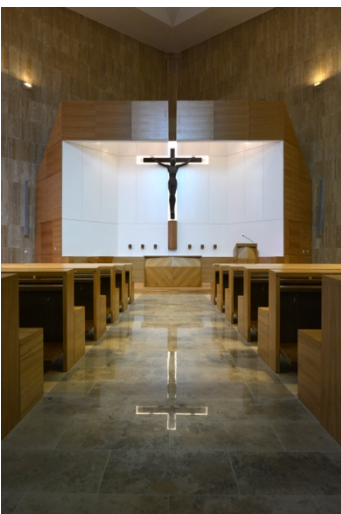
Budapest-Vizafogói Tours-i Szent Márton templom - liturgikus tér 2017

A második rész lezárásaként az értekezés az épület fogadtatását vizsgálja korabeli újságok felkutatásával és magánvélemények segítségével.