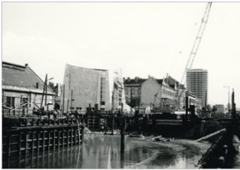
Metróépítés a Váci úton - fotó

ellenőre volt, aki így már tervezőként is végig kísérhette a templom megépülését. Az értekezés ezen része feltárni igyekszik a racionális okokat és személyes ellentéteket, melyek az elmérgesedett helyzethez, végül a tervezőváltáshoz vezettek.