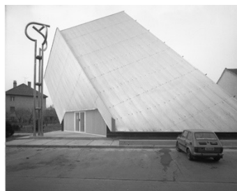
Budapest-Vizafogói Tours-i Szent Márton templom - Szabó István templomainak kontextusában