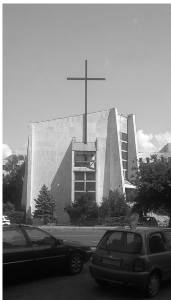
Budapest-Vizafogói Tours-i Szent Márton templom - nyugati homlokzat

A hozzánk közel álló korok építészeti örökségének megítélése problémát jelent a kortárs építészek számára. Míg az ötven évvel ezelőtti épületek és alkotók munkássága már elismert, a fiatalabbakkal szemben kezdeti egységes elutasítás tapasztalható. Az emlékezet és elismerés hullámai most kezdik felemelni az előző évtizedek építészetét, ahogy ezt korábban a szocreállal is megtették.