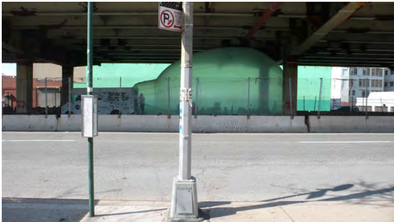
Spacebuster | Raumlabor | 2009

A kortárs aktivista közegben egyre több példát találhatunk, ahol járművek átalakításával köztéri szituációkat teremtenek a csoportok valamilyen kritika mentén. A Raumlabor Spacebuster 13 programja elhagyatott városi területeket alakít ideiglenesen használható térré, hogy képes legyen a területtel kapcsolatos viták, közösségi események befogadására.