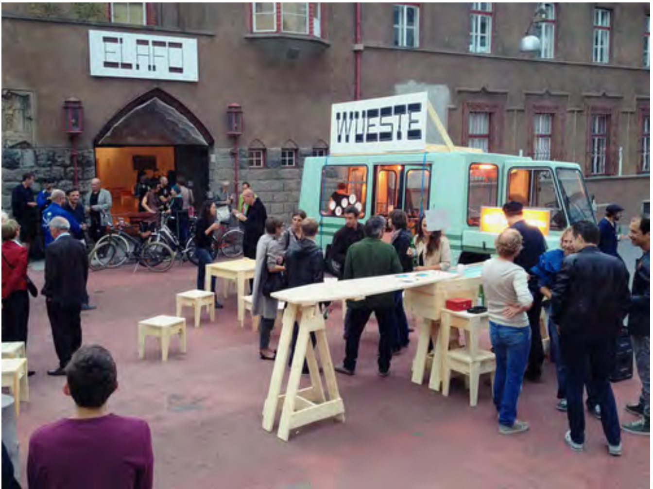
Wueste | Kiosque 17