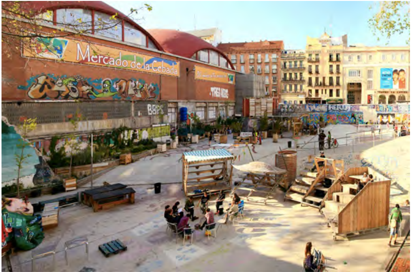
Campo de Cebada | Madrid 9

A madridi Campo de Cebada esetében az önkormányzati terület első ideiglenes használatát a francia EXYZT csoport valósítja meg a City Island 8 keretében 2010-ben. A párhuzamosan erősödő civil szféra pedig eléri a kormányzatnál a terület hosszabb távú használatba vételét, hogy aztán demokratikus döntések mentén működtesse azt.