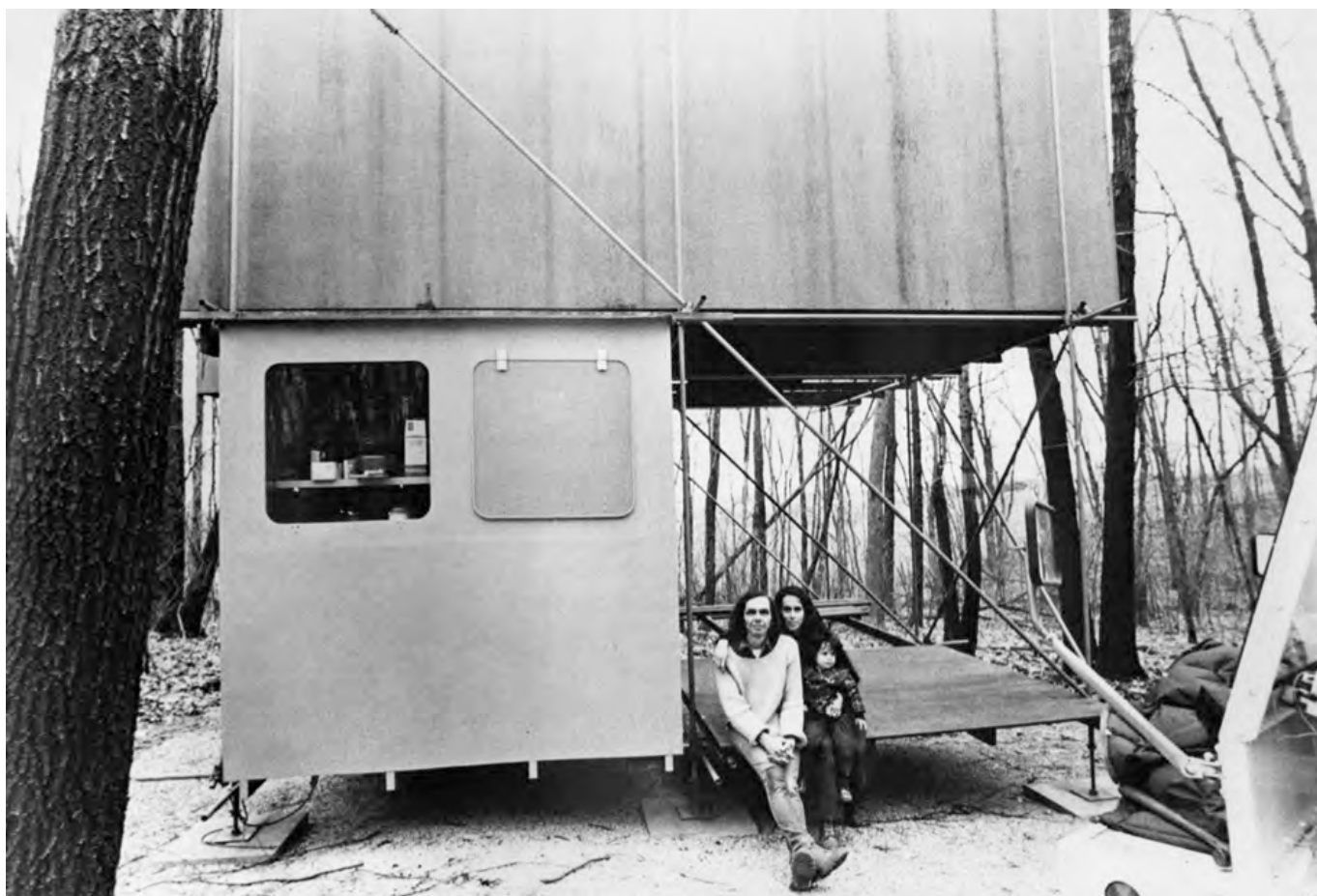
How to build your own living Structure | KEN ISAACS 5

Drasztikusabb beavatkozás eredménye a bukaresti Calae Mosillo sugárút mellett épített panelházsor és a történeti városszövet között kialakuló élhetetlen térstruktúra. Az intenzívebb városi környezet sokkal szélsőségesebb társadalmi hatásokat eredményez a "nem helyeken". A Magic Blocks 4 programja a komplex vizsgálat és tervezés mellett egyszeri mikro-beavatkozások sorával próbál reagálni a feltárt problémákra. A létrehozott elemek többsége a beágyazottság és a karbantartás hiányában gyorsan asszimilálódik a korábbi környezethez ellentmondva a program eredeti céljának. Néhány térelem eredeti funkciójától megfosztva vélhetően a lakók által átalakítva köztéri paddá változik. Ezen e területen szomszédási aktivitás található, amire érdemes építeni.