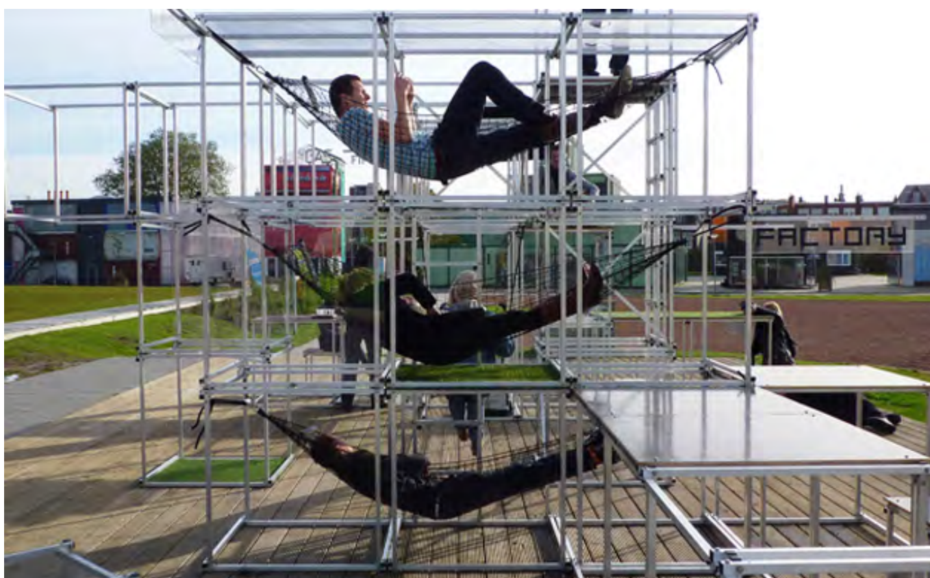
Open City | N55