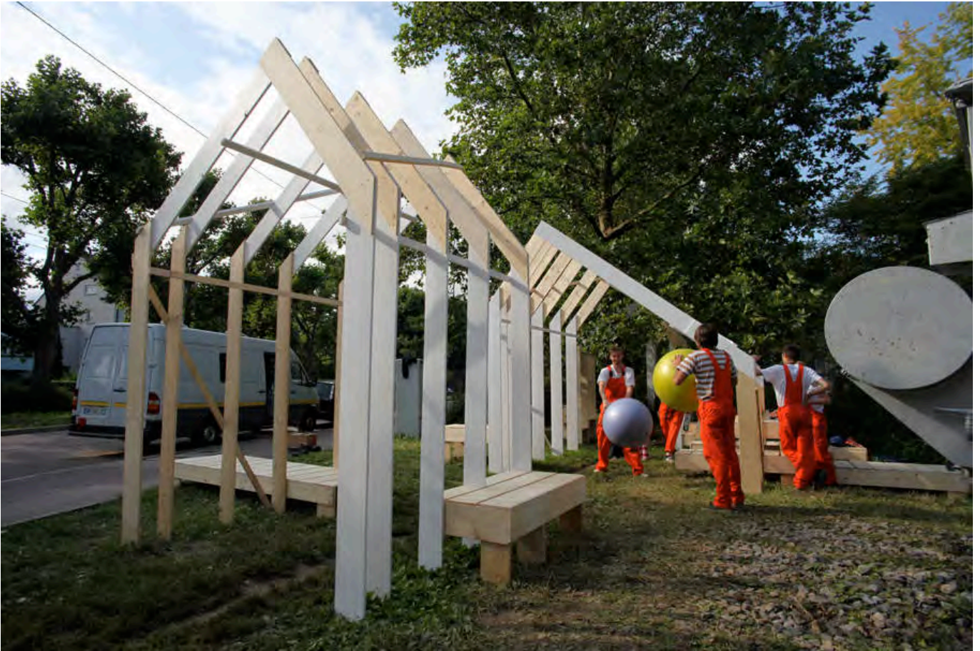
72 hours urban action | Stuttgart | 2012 | forrás: http://samuelboche.overblog.com/72-hours-urban-action