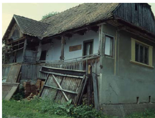
2-3. ábra Hagyományos falukép, archív fotó - Lókodi Ifjúsági Alapítvány