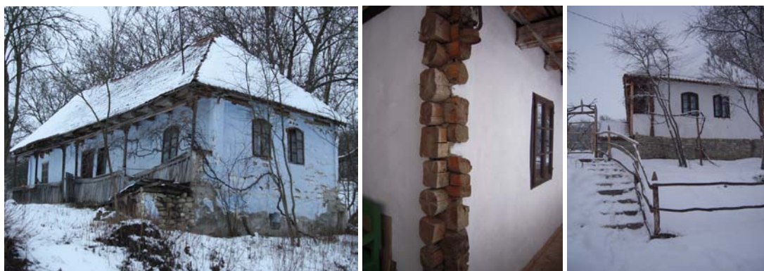
4. ábra Lókodi tájház, archív fotó - Lókodi Ifjúsági Alapítvány 5-6. ábra saját fotó 2012. dec.

A 2009-ben kezdődő átfogó restaurálási munka eredménye a falu 200 éves tájházának felújítása. A létrehozott infrastruktúrával lehetőség van körülbelül 65 gyermek és fiatalról gondoskodni. A projektek az önfenntartást célozzák meg a helyi munkalehetőségek megteremtésével.