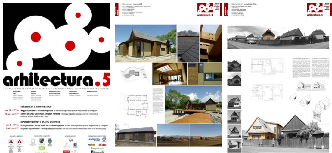
7-9. ábra a kiállítás és a két pályamű plakátja