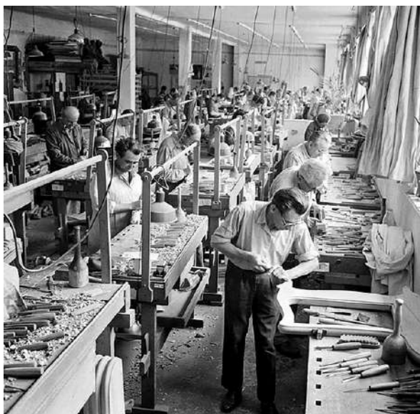
BUBIV, 1964. Április

Az ipart determinálta az a tény, hogy Magyarországot a vas és acél országának kiáltották ki. 1958-ban a bútortiparban dolgozó 24 000 ember 28%-a dolgozott csak az állami iparban. Az összevont gyárakban még mindig 20-30 éves, a két háború közti időszakból származó gépekkel folyt a termelés, a gépeken töltött idő a munkaidő 26-28%-a volt, ami a fejlett nyugati országok adatainak csupán a fele. 6