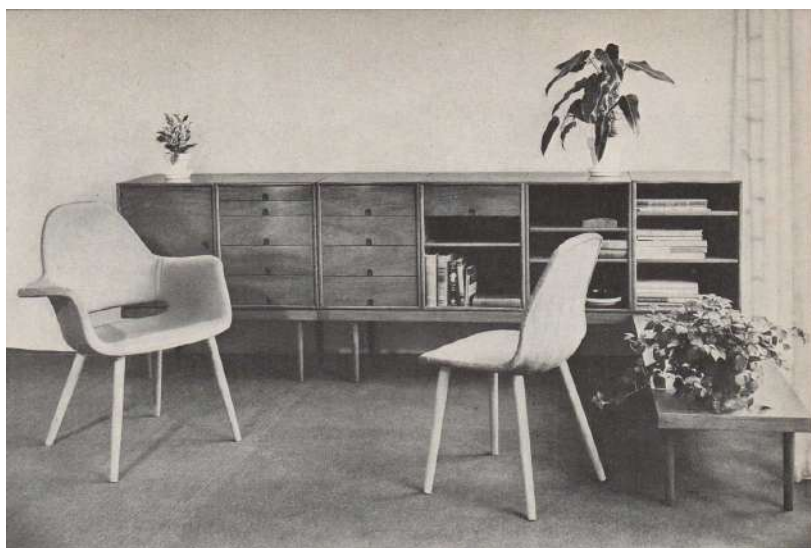
Charles Eames és Eero Saarinen, Organic szék, 1940

Az Erika szék formálását vizsgálva erős párhuzam lelhető fel Charles Eames és Eero Saarinen Organic chair székével. A tervezési dátumokat összevetve akár előképül, inspirációként is hathatott az elismert nyugati tervezők terméke. A széket 1940-ben a Museum of Modern Art, New York „Organic Design in Home Furnishing” pályázatára tervezték. A művészi formált „shell” felsőrész prototípusát fémhálóból és gipszből készítették, maximálisan előtérbe helyezve az emberi test követését. A nagyipari gyártósorok technológiai fejletlensége miatt sorozatgyártásba csak 1950-re került, kárpitozott hajlított rétegelt lemez felsőrésszel és tölgy vagy kőris lábakkal. Piacra kerülése óta a VITRA cég palettája közt folyamatosan elérhető a termék több verziója is.