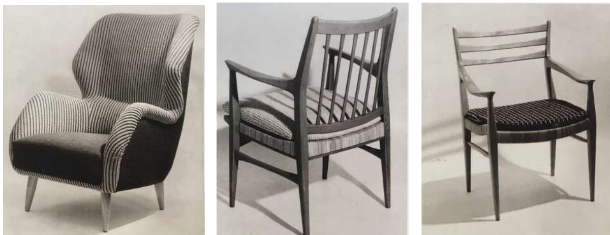
Füles fotel, Gellért Szálló