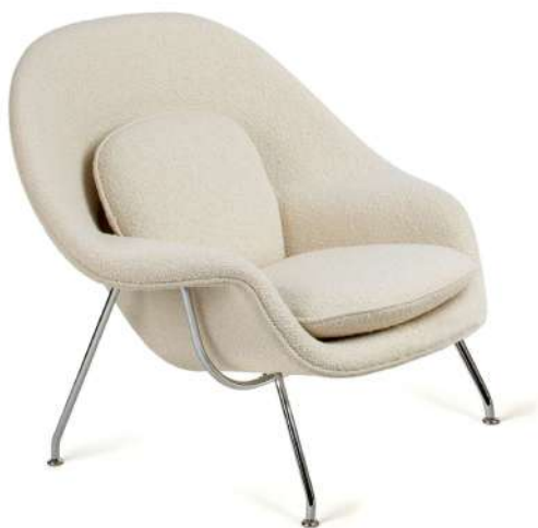
Eero Saarinen, Womb szék, 1948

Az amerikai Knoll cég felkérésére, Eero Saarinen által 1948-ban tervezett Womb chair, hatással lehetett Mózser László munkásságára. Az ikonikus darabon jól olvasható módon megjelenik a modern folytatásaként jellemző anyag- és formahasználat. A króm lábak és kárpitos felsőrészek párosításából kialakuló kontraszt mégis összhangot teremt a fotel egészét nézve.