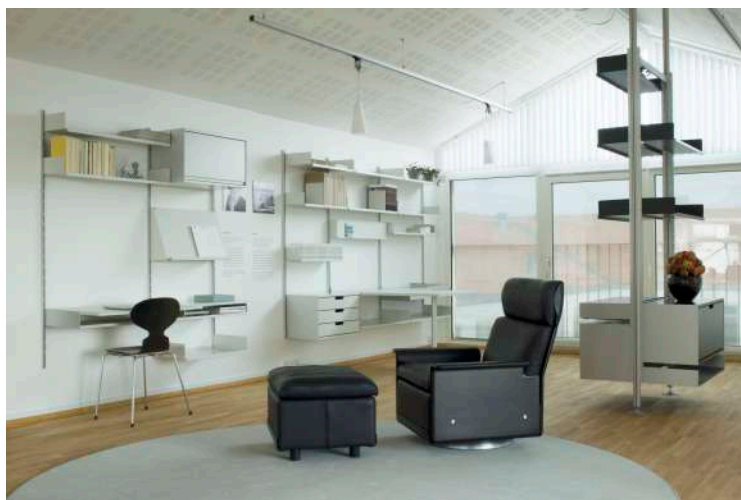
Vitsoe 606 Shelving System, 1959

Számos skandináv ugyancsak „string wall”-nak hívott berendezés mellett az angol Vitsoe cég variálható bútorait érdemes még előképként megemlíteni. 1959-ben a Braun cégnél dolgozó mindössze 23 éves Dieter Rams tervezte, a később 606 Universal Shelving System néven gyártásba kerülő moduláris fali rendszert. A hajlított fém anyaghasználat miatt egy sokkal hidegebb megjelenés jellemzi ezt a moduláris rendszert. Felépítésében annyiban tért el a Bodnár János által tervezett variálható szobafalaktól, hogy itt a falhoz rögzített sínre lehetett akasztani a kiegészítő elemeket, ezzel egy teljesen légies hatást érve el az enteriőrben.