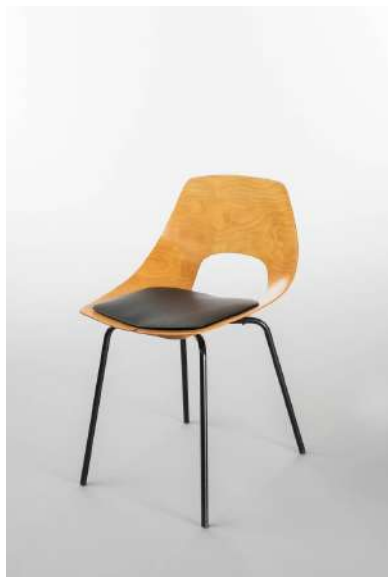
Tonneau szék, 1951